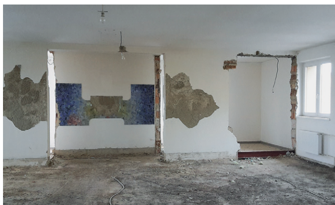
Po dokončení bouracích prací