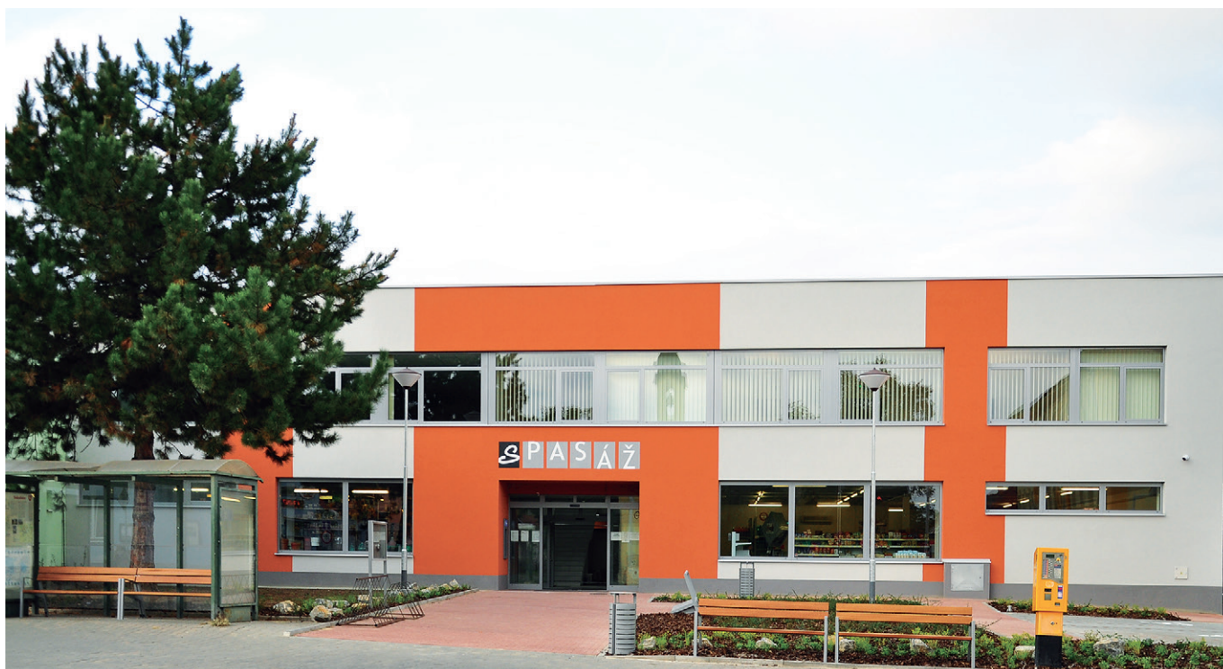
Budova S-pasáže po rekonstrukci