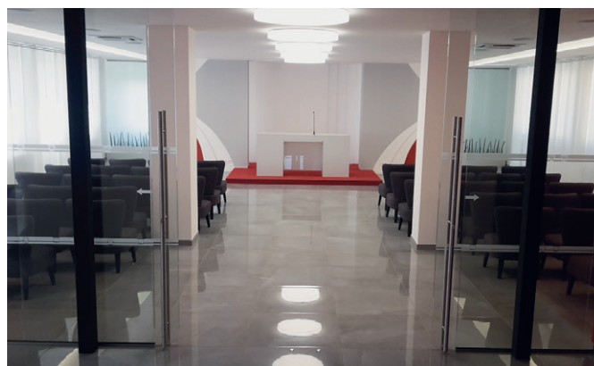
Obřadní síň po rekonstrukci