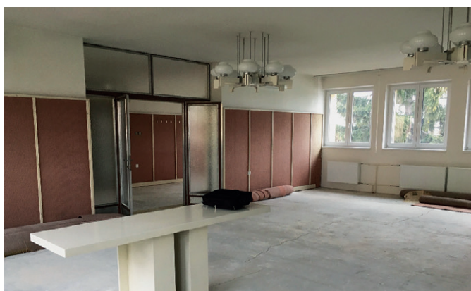
Obřadní síň těsně před rekonstrukcí