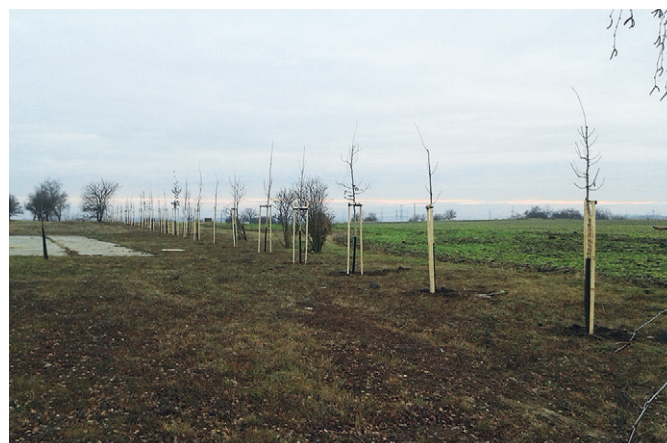
Výsadba stromů v areálu kasáren Předky

Naše žádost byla Nadací ČEZ kladně posouzena a v listopadu jsme obdrželi návrh na uzavření smlouvy a následně i částku 100.000 Kč. Výsadba probíhala v termínu od 29. listopadu do 9. prosince 2016, byla zajištěna prostřednictvím odborné firmy AGRO Brno-Tuřany, a.s., která dodala nejenom rostlinný materiál, ale i kůly, úvazy a její pracovníci též realizovali samotnou výsadbu. Za poskytnuté finanční prostředky bylo vysázeno celkem 51 stromů: 5x jeřáb sladkoplodý; 12x třešeň; 8x hrušeň; 8x jabloň; 8x javor babyka; 10x dub letní.