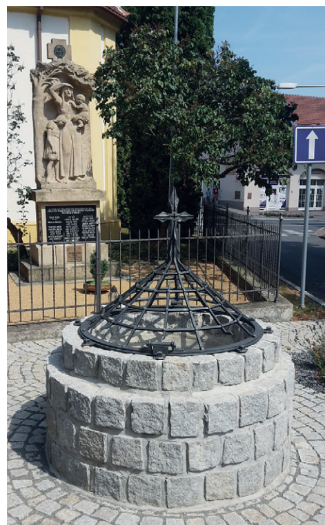
Znovuobjevená studna na Masarykově ulici

Následně poté obec nechala zatravnit a vysázet záhony okrasných květin na ulici Komenského a Masarykova. Mimo to na Masarykově ulici zrenovovala (v rámci sta-