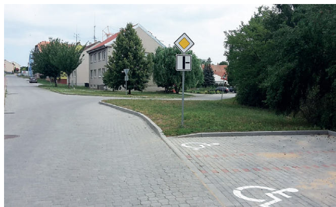
Nový tvar křižovatky Podešvova-Topolka