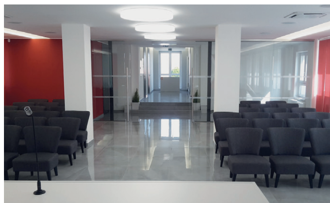
Pohled z pozice oddávajícího