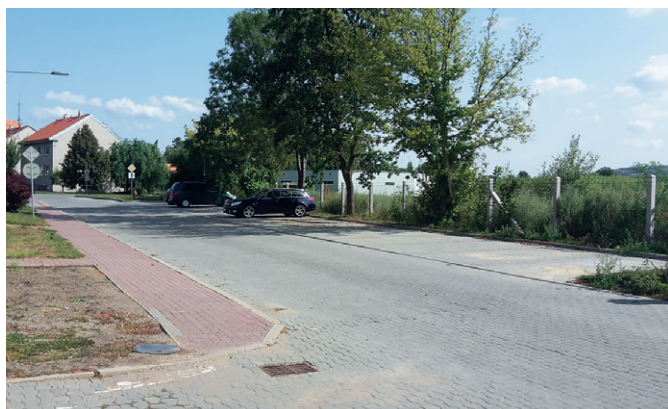
Podešvova – lokalita „U Cukrovaru“