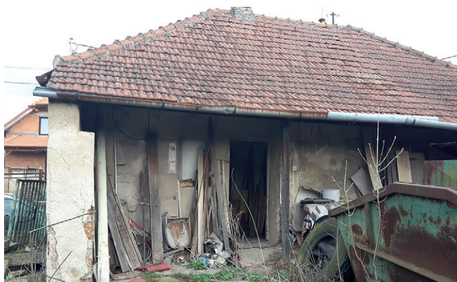
Budova zámecká 150 před odstraněním

stranění objektu budovy č.p. 150. Náklady na její odstranění byly vyčísleny na částku 660.247 Kč. Vzhledem ke skutečnosti, že se podařilo zajistit 4 brigádníky z řad studentů, došlo k odstranění stavby ve spolupráci s kmenovými zaměstnanci obce cca za pětinovou cenu. Na jejím místě by do budoucna měla vyrůst stavba, kde by vzniklo zázemí pro pracovníky obce (dílna, šatny, sociální zařízení), které prozatím mají ve sklepě budovy OÚ, zázemí pro naši techniku (auto, traktůrek, sekačky, štěpkovač,