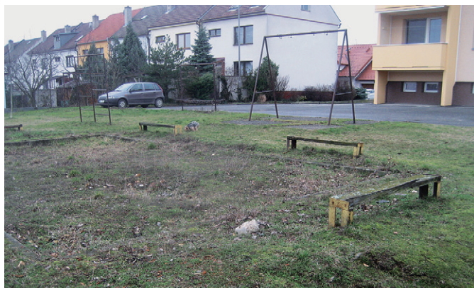
Původní podoba dětského hřiště na ul. Nová

Náklady na realizaci tohoto projektu vč. zemních prací byly cca 100.000 Kč.