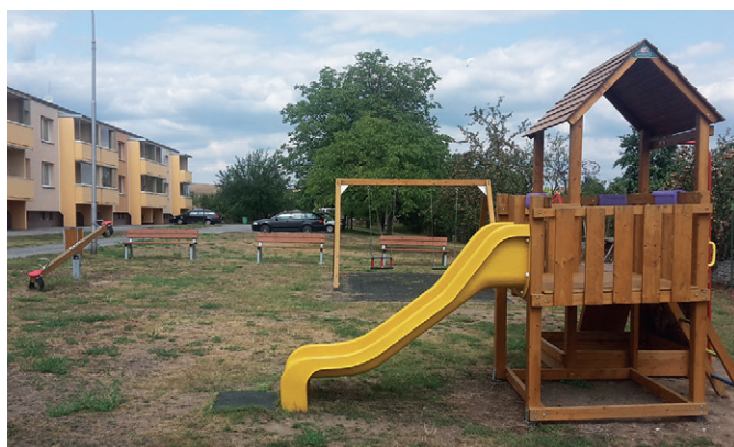
Dětské hřiště dnes