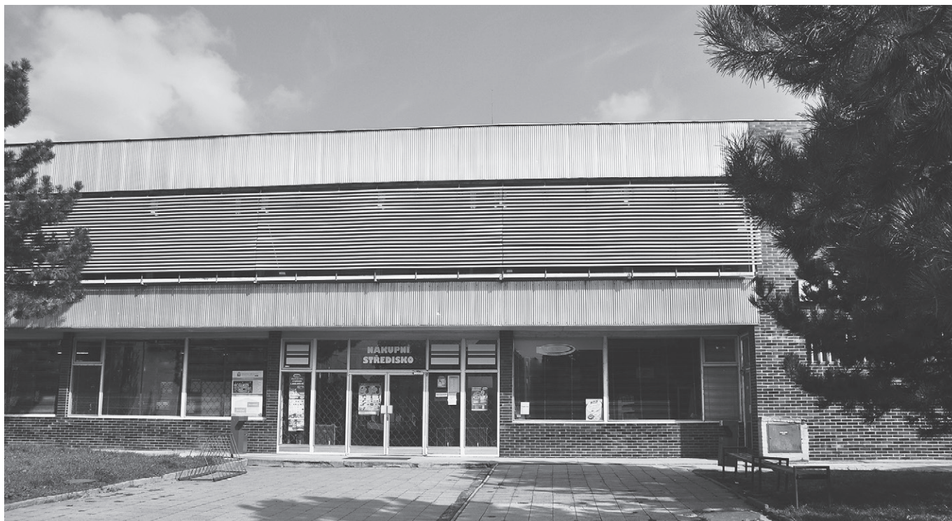
Budova S-pasáže před rekonstrukcí