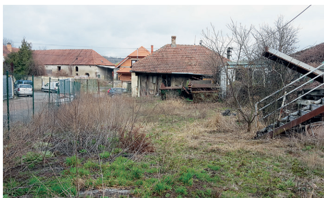
Areál zakoupených pozemků