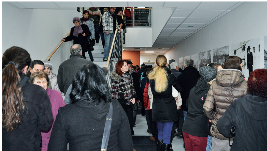
Otevření a prohlídka S-pasáže

Vánoční strom – s celkovou rekonstrukcí budovy S-pasáže se pojí i jedna nová, krásná, tradice, která byla zavedena v roce 2015. Jedná se o rozžínání vánočního stromu, který je pokaždé v adventní čas umístěn před tímto objektem. Vánoční strom pocházel doposud vždycky z naší obce, bývá ozdoben 30 světelnými řetězy, 45 ozdobami a hvězdou. Mimo to se stalo tradicí, že před samotným aktem rozsvícení zazpívají žáci MŠ, ZŠ a místní umělci a pro přítomné diváky bývá nachystáno teplé občerstvení. Doufáme, že si tato tradice najde v naší obci pevné místo i pro další léta.