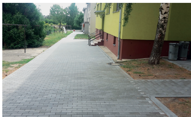
Zpevněné plochy kolem bytových domů v ulici Podešvova

stání, z toho 2 stání byla vyhrazena pro osoby s omezenou schopností pohybu. Parkovací stání byla realizována ve stávající neudržované ploše za krajem vozovky a rozdělena na 2 skupiny po 19 a 3 stáních. Mezi skupinami stání je elektrický rozvaděč, který zde musel být zachován. Parkovací stání pro osoby s omezenou schopností pohybu jsou na konci úseku tak, aby z nich byl přístup přes silnici na chodník v místě, kde je sklopený obrubník.