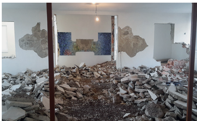
Průběh rekonstrukce obřadní síně

Součástí stavebních úprav 2. NP bylo nové položení keramické dlažby na schodiště mezi suterénem, 1. NP a 2. NP a v severní vstupní části (venkovní schodiště), ukončené před částí obecního úřadu. Dále proběhla rekonstrukce