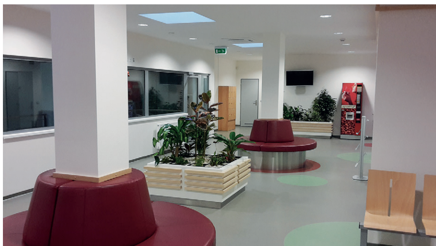
Interiér centrální čekárny