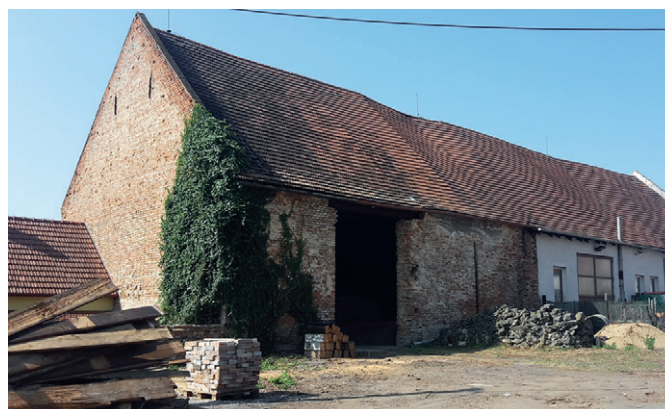
Vyklizený areál před budovou zemědělského stavení p.č. 491

Periodický tisk územního samosprávného celku Sokolnický zpravodaj, vydává obec Sokolnice, Komenského 435, 664 52 Sokolnice, IČO: 282596. Je vydáván desetkrát ročně. Místo vydávání Sokolnice. Nemá žádné regionální mutace. Náklad 930 výtisků. Určeno k bezplatné distribuci. Řídí Komise pro vydávání Sokolnického zpravodaje. Evidenční číslo tisku přidělené MK ČR – MK ČR E 10168.