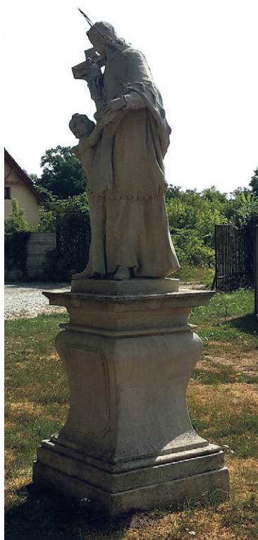
Socha sv. Jana Nepomuckého

Barokní socha, v mírně nadživotní velikosti na odstupňovaném soklu, je datována do 1. poloviny 18. století. Objekt je evidován v Ústředním seznamu kulturních památek. Již delší dobu tato památka, umístěná v malém parčíku na ul. Topolka (před Sběrným střediskem odpadů), volala po obnově. Proto na jaře tohoto roku, v rámci rekonstrukce, byly z povrchu sochy a podstavce sejmuty kolonie náleto- vých rostlin a vrstvy depozitů atmosférického spadu. Bylo provedeno ošetření povrchu herbicidem. Drobné lokality s narušenou strukturou kamene byly napuštěny zpevňovačem. Chybějící části byly doplněny umělým ka-