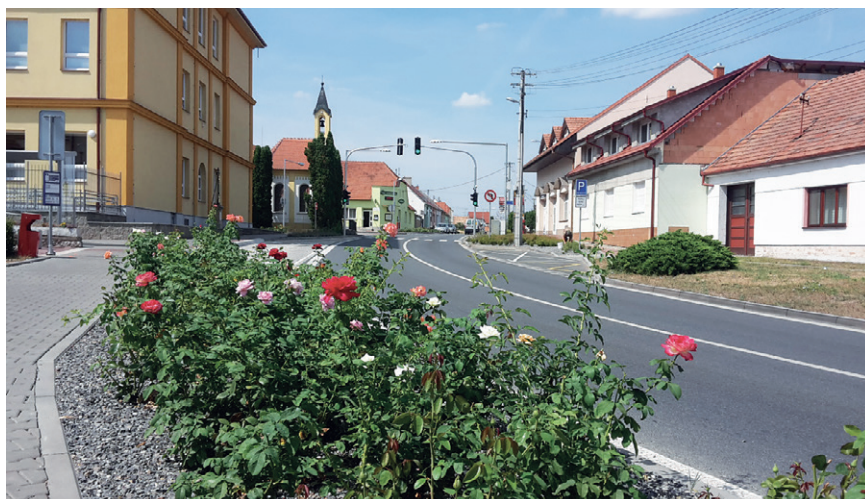
Výsadba navazující na dopravní úpravy v centru obce