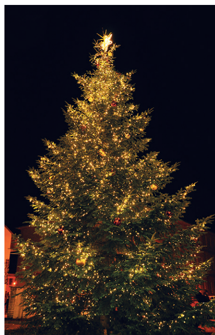
Vánoční strom před budovou S-pasáže