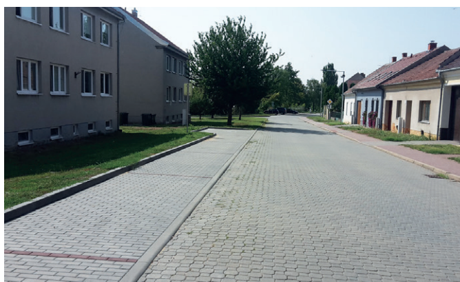
Parkoviště ul. Podešvova