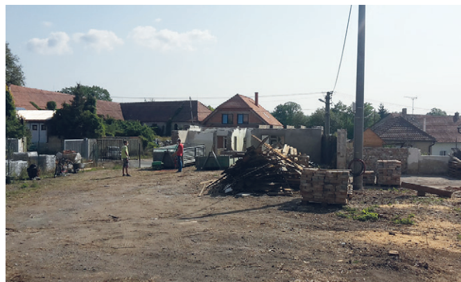
Areál v průběhu demoličních prací

atd.), které jsou rozmístěny na několika místech (pronajatá garáž od společnosti Atol na ul. U Cihelny, či prostory bývalého zdrav. střediska). No a v budově bývalého zemědělského stavení může vzniknout prostor, kde by do budoucna mohla obec realizovat některé ze svých plánů, jak ještě více zkvalitnit služby v naší obci.