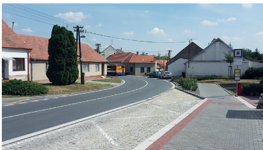
Autobusový záliv před budovou OÚ

přilehlých chodníků a sjezdů, připojujících sousední nemovitosti. Parkovací stání (nám. Zbyňka Fialy, ulice Pod Stráží) – stavební úpravy obsahovaly též rozšíření stávajících parkovacích stání na náměstí Zbyňka Fialy. Ze stávajících 4 míst na 9 míst a zřízení nových 5 parkovacích stání v prostoru ulice Pod Stráží.