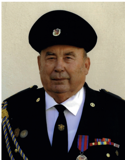
Fotografie z ocenění „Zasloužilý hasič“

Za těch 70 let se dobrovolné hasičství velmi proměnilo. Kdysi se jezdilo skutečně jenom k požárům, ale dnes se vyjíždí mnohem častěji k doprav-