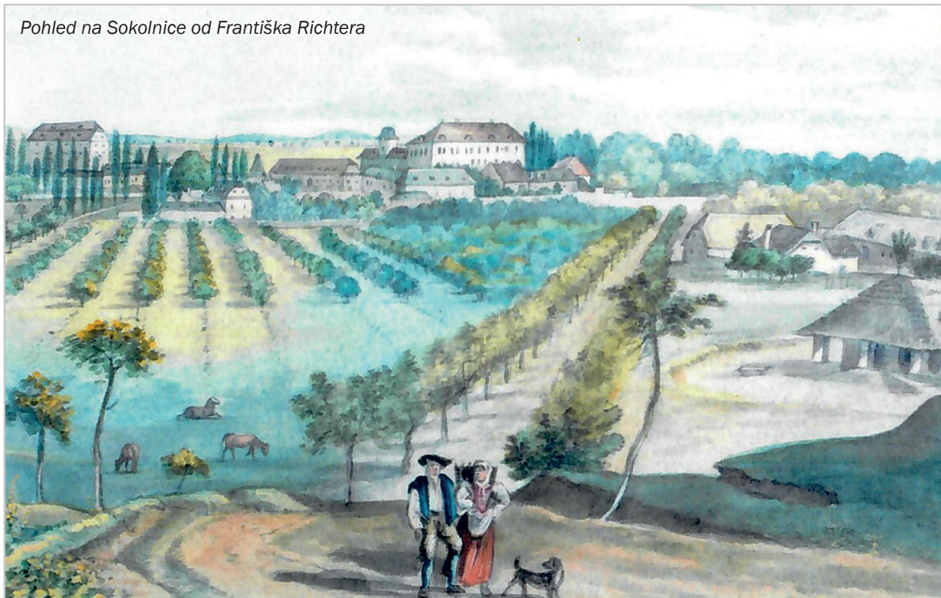
Pohled na Sokolnice od Františka Richtera