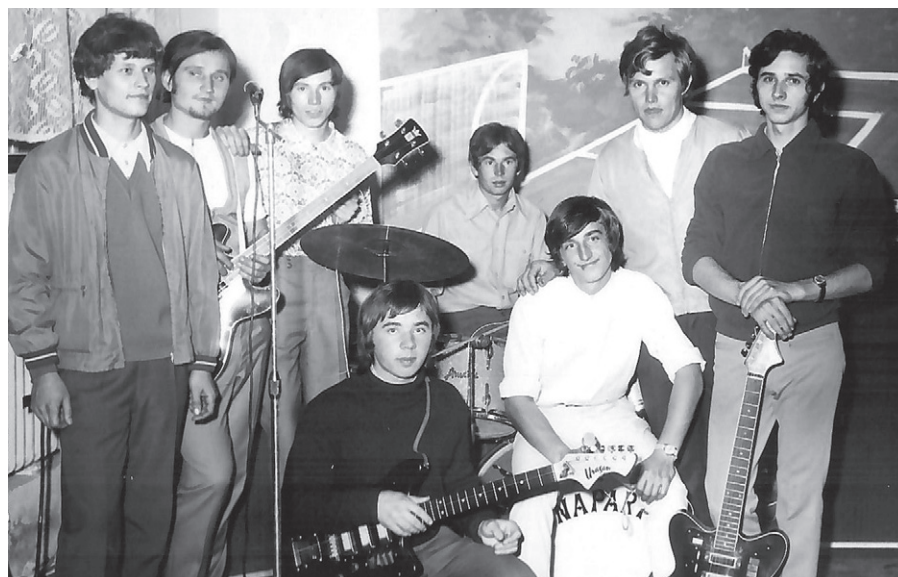
Rok 1972 nebo později

-Podle původního textu zpracovala Miroslava Mifková-