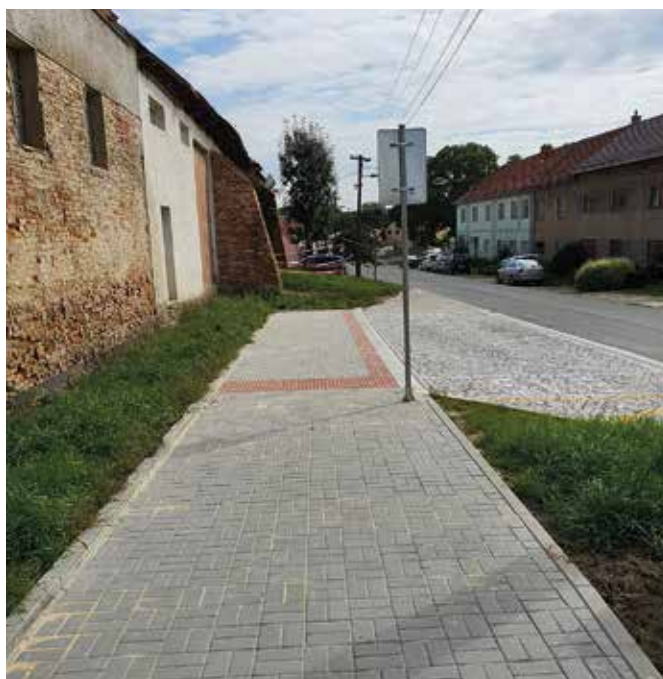
Ulice Zámecká po realizaci – autobusová zastávka