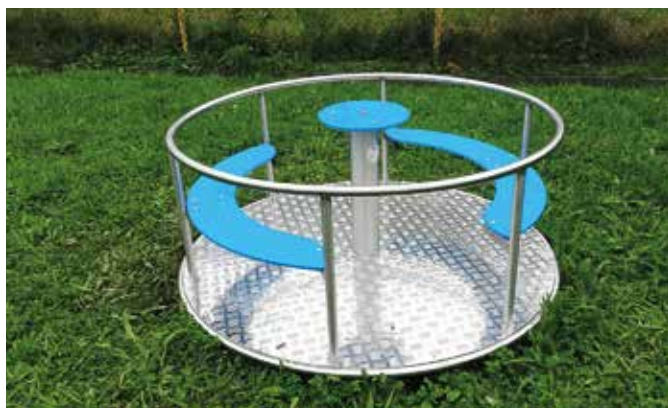
Dětský kolotoč u Husara