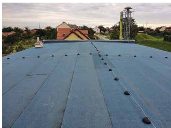
Rekonstrukce střechy hasičské zbrojnice

Na podzim roku 2019 začalo zatékat do budovy požární zbrojnice JSDH Sokolnice, neboť došlo k porušení povrchové úpravy střechy vlivem jejího opotřebení a klimatických podmínek. Na počátku měsíce září pokrývačská firma zahájila práce na její renovaci. Byly položeny dva živičné pásy (s ohledem na stavebně-technické řešení stropu nešlo na střechu použít fólii), které by problém se zatékáním měly dlouhodobě vyřešit. Opravu střechy