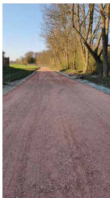
Realizace cyklostezky Sokolnice-Kobylnice