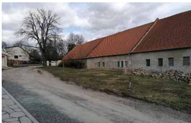
Ulice Zámecká před realizací