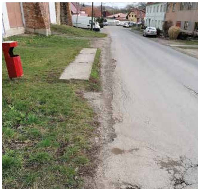
Ulice Zámecká před realizací – autobusová zastávka