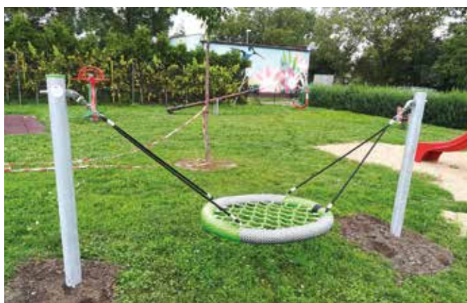
Hnízdo U Husara