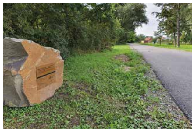
Realizace cyklostezky ►