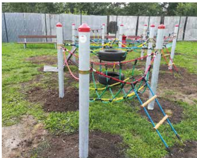
Skřítkův les U Husara

Naše obec se v předchozích dvou letech neúspěšně ucházela u Ministerstva pro místní rozvoj o možnost doplnit naše dětská hřiště o nové herní prvky. Teprve letos jsme byli s naší žádostí úspěšní a mohli jsme tuto investici zrealizovat. Nutno podotknout, že herní prvky v minulosti vybíraly samy děti, kdy žáci třetích a čtvrtých tříd hlasovaly pro jednotlivé atrakce. V měsíci srpnu pak firma Tewiko osadila na dětská hřiště U Husara, u Bednáry