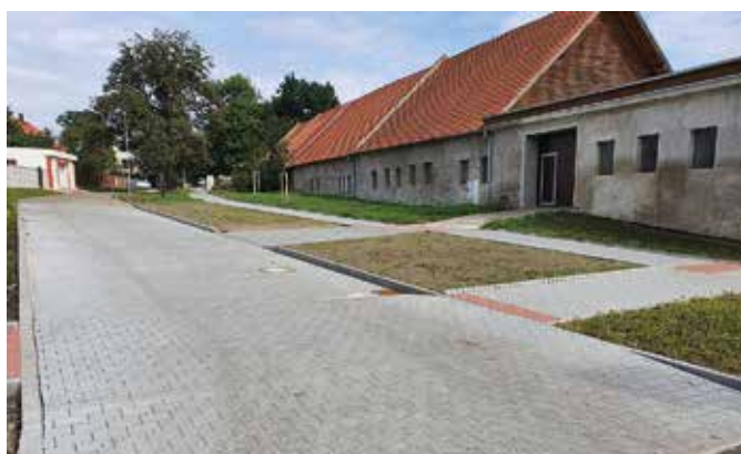
Ulice Zámecká po realizaci