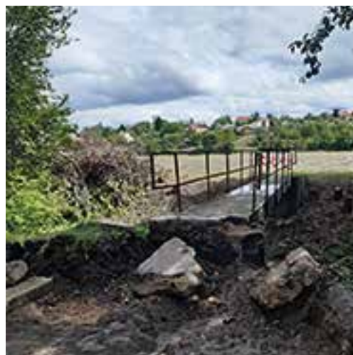
Realizace cyklostezky Sokolnice-Telnice