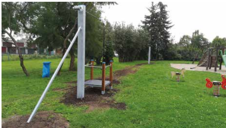
Lanová dráha u Bednáry

a na ul. Nová celkem 6 herních prvků. Celkové náklady na realizaci byly vyčísleny na 614.292 Kč, kdy z MMR jsme obdrželi dotaci ve výši 430.005 Kč a z vlastních zdrojů jsme uhradili 184.287 Kč. Mimo to obec plánuje, že na dětské hřiště U Husara ještě umístí na přelomu měsíce září a října kryté pískoviště, aby i ty nejmenší děti měly možnost vyžití.