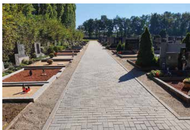
Hřbitov před realizací