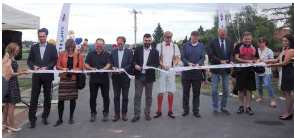
Slavnostní otevření cyklostezky