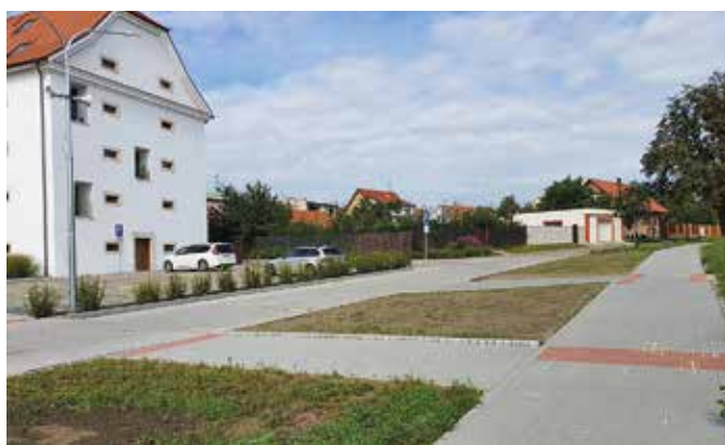
Ulice Zámecká po realizaci