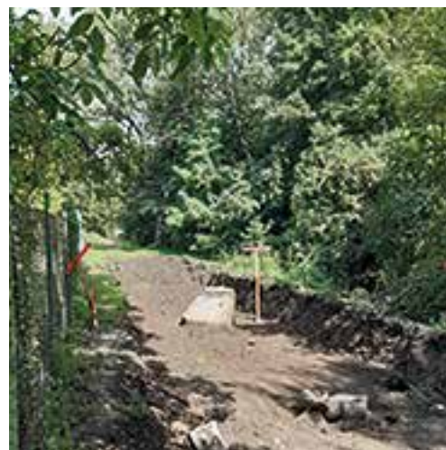
Realizace cyklostezky Sokolnice-Telnice