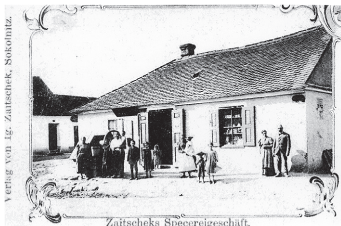
Verlag von Ig. Zaitschek, Sokolnitz.