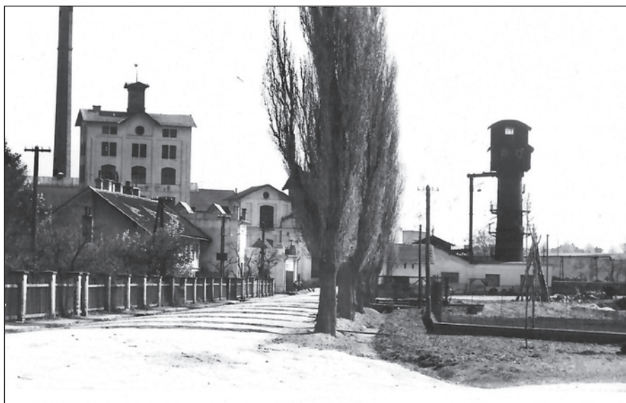
Zadní brána, pohled od sochy sv. Jana u SSO

Po těchto přípravných jednáních se konala dne 30. prosince 1913