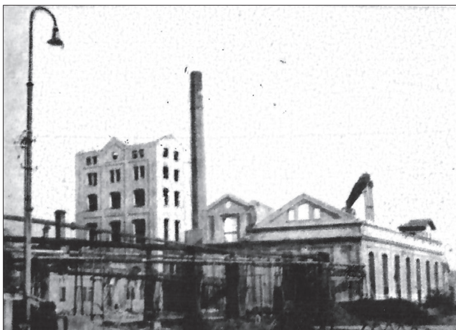
Tragická podívaná na vypálený cukrovar po konci druhé světové války

V druhé polovině roku 1990 oslavil cukrovar v Sokolnicích jubileum 150 let svého trvání. Vlastní oslava nebyla adekvátní tomuto významnému jubileu a byla poznamenána celkovou atmosférou a děním nejistoty a předtuchy o další existenci cukrovaru. Různé osobní a podnikatelské zájmy, názorová neshoda a absolutní nezájem kompetentních míst, to vše bylo rozhodující pro zastavení další