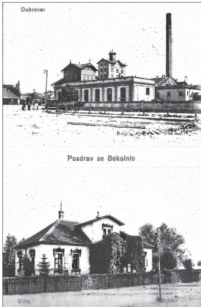
Tištěná pohlednice s cukrovarem a vilou pro zaměstnance (pravděpodobně nejstarší dochovaný pohled na budovy)