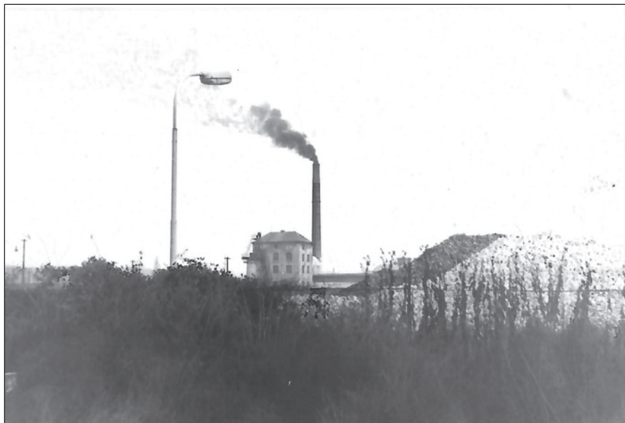
Napravo od budovy je vysoká skládka řepy

Listopadové události v roce 1989 a tím následně vzniklé změny politicko-ekonomických poměrů velmi negativně zasáhly a ovlivnily další poměry a situaci cukrovaru. Jak se později ukázalo, přímo osudově.