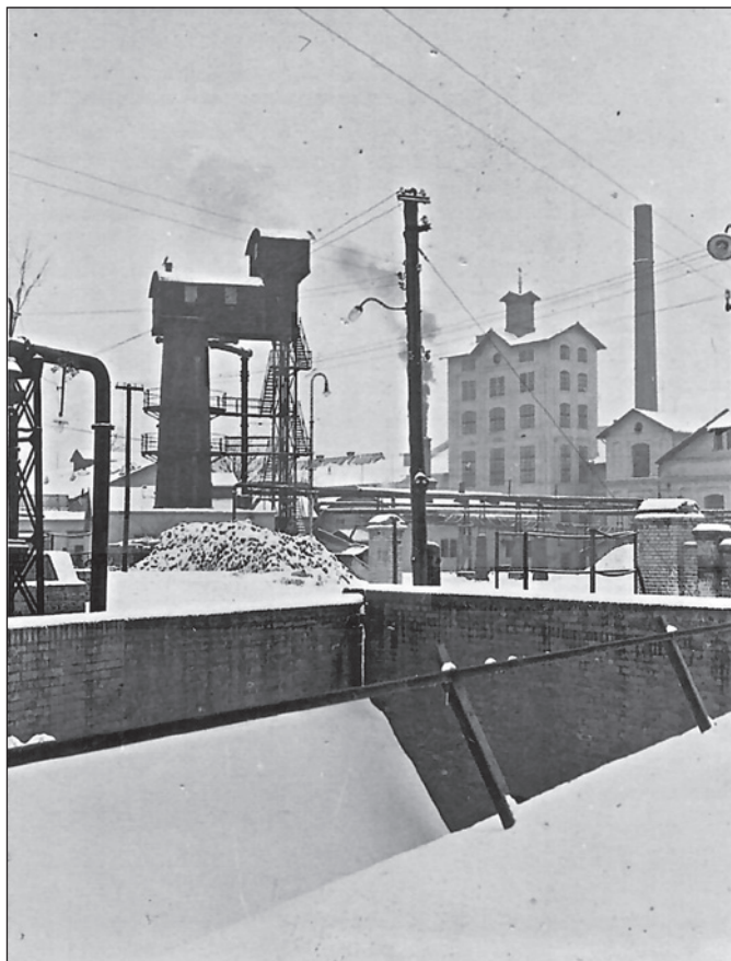
Splavy a vápenka

Cukrovar prošel mnoha modernizacemi a změnami, k největší modernizaci došlo v r. 1963. Sokolnický