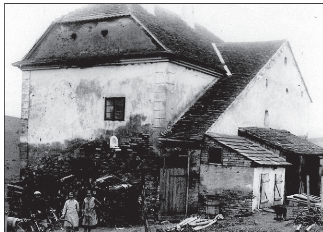
Presshaus Sokolnice (poválečná fotografie)

Presshaus byla lisovna v Sokolnicích. A kolem ní se prý pohybovala blíže nespécifikovaná ruská komise v blíže neurčeném čase, nicméně jistě velmi dávno před něko- lika generacemi. Co vše si lze pod tímto tvrzením před- stavit? Nebyl nalezen žádný archivní zápis. Pohyb nějaké ruské komise by však musel být nutně pod dohledem