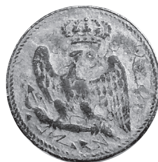
Francouzský knoflík z lokality nad sokolnickým zámekem