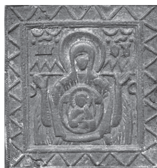
Ruská mosazná ikonka nalezená u Sokolnic