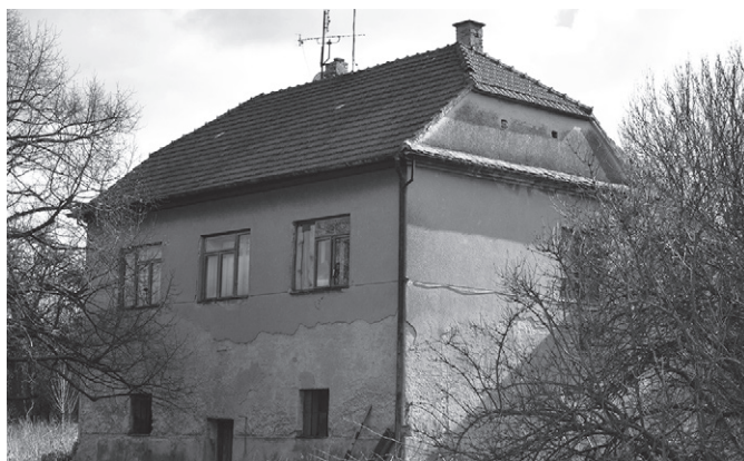
Presshaus Sokolnice (2017)