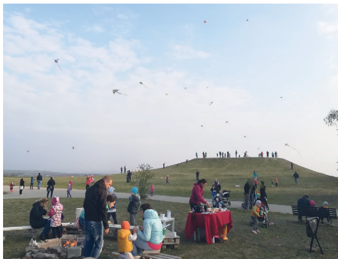
Draci krásně poletovali

Nad bývalými kasárnami se ve vzduchu honilo kolem čtyřiceti draků, dětí však přišlo ještě víc. Všechny dostaly památeční kartu s omalovánkou draka a sušenku. Po celou dobu drakiády se zahřívaly čajem a dospělí i svařeným vínem. V příjemné atmosféře jsme pouštěli draky až do pozdního večera a vyhnala nás domů až tma a chlad. Prožili jsme krásné odpoledne. -Tereza Šteflová-