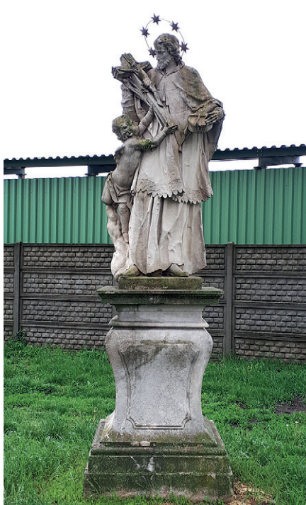
5 Socha sv. Jana Nepomuckého