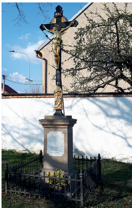
2 Kříž Telnická