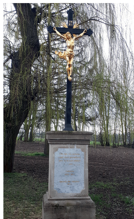
6 Kříž hřbitov