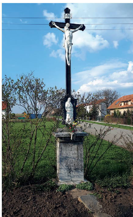
4 Kříž Šlapanická