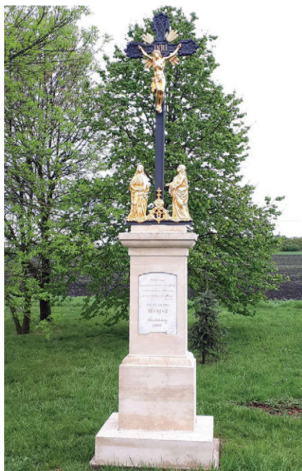
1 Kříž Brněnská

Obnova a oprav se dočkala v roce 2015 socha Sv. Jana Nepomuckého, kterou najdete u střediska sběrného