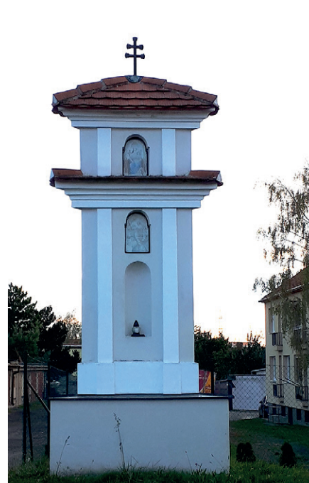
3 Boží trojice