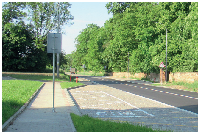
Autobusové zastávky u hřbitova

Celé letošní jaro intenzivně pracovala společnost Prostavby a.s. na výstavbě autobusových zastávek u hřbitova. S časovým předstihem byla stavba dokončena a předána obci. Nyní obec požádala o vydání příslušných kolaudač-