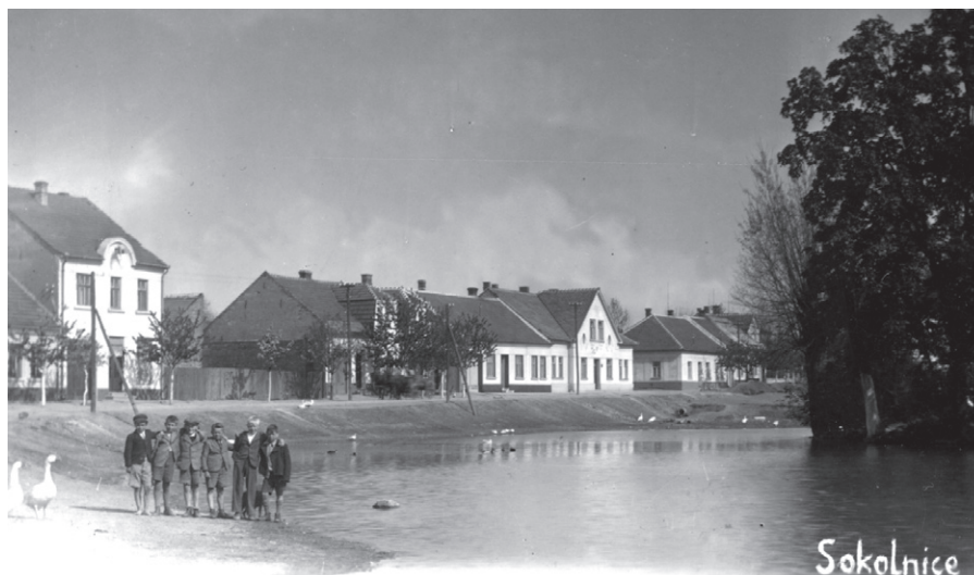
Návesní rybník kolem roku 1942

Nyní se mně vybavují vzpomínky nejen na mé dětství. To byla panečku jiná doba. Rodiče na dovolenou moc peněz neměli, a tak jsme byli rádi, když jsme mohli naši vesnici na chvíli vystřídat s třítydenním pobytem v táboře někde v lese. Po návratu jsme pak většinou zbytek prázdnin prožili v okolí domova. A když nastala letní vedra? Jaká to byla výhoda mít v obci rybník! Nevadilo nám, že kolem nás plavaly husy a kačeny, někdy se v něm plavili i koně. Rodiče neměli strach, že dostaneme ekzém nebo nějakou vyrážku. Spojení s ostrůvkem nebylo, jen o letních karnevalech, to pak se stavěl provizorní most. Stále ale byla u břehu přivázána lodka a tu si mohl kdokoli a kdykoli odvázat a svézt se po rybníce.