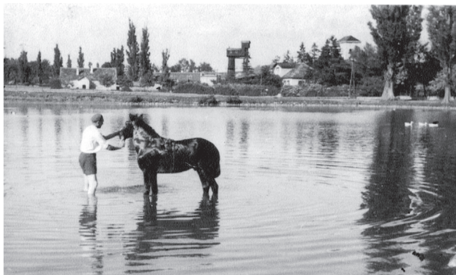
Plavení koně v rybníku v Sokolnicích, v pozadí cukrovar