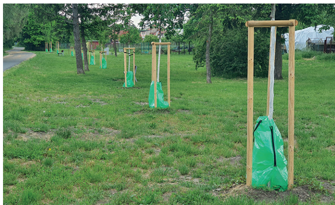
Výsadba stromů – cyklostezka ve směru na Kobylnice

V loňském roce byla v naší obci dokončena výstavba cyklostezek ve směru na Kobylnice a na Telnici. Obec ještě před jejím dokončením plánovala, že tuto stavbu doplní o výsadbu stromů. První etapa ve směru na Telnici již byla provedena v květnu a kolem cyklostezky máme vysázené nové stromy. Druhá etapa ve směru na Kobylnice bude uskutečněna ve vhodném agrotechnickém termínu na podzim tohoto roku.