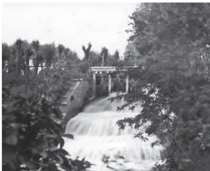
Splav u Kobylnic

Jiřiny, roz. Floriánové, jsem se dozvěděla, že po 2. světové válce ještě tekla potok po povrchu, kolem sochy sv. Jana Nepomuckého a podél dnes již nám známého plotu cukrovaru tekla až do rybníka. Později byl asi sveden do betonových skruží. V 70. letech minulého století byl vybudován rozsáhlý zavlažovací systém pod názvem „Závlahy pod Brnem“. Byly vybudovány dvě vodní nádrže, jedna pod „Černým vrchem“, druhá pod „Mohyloou míru“. V té době tekla voda do rybníka z nádrže „Balaton“. V současné době přítok do rybníka není a vodu rybáři přečerpávají ze Zlatého potoka.