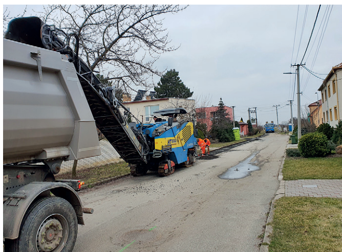
Oprava komunikace v ulici Tuřanská

Celé letošní jaro intenzivně pracovala společnost Prostavby a.s. na výstavbě autobusových zastávek u hřbitova. S časovým předstihem byla stavba dokončena a předána obci. Nyní obec požádala o vydání příslušných kolaudač-