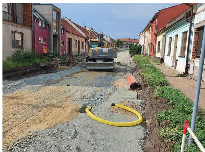
Rekonstrukce ulice Niva

ních rozhodnutí u SÚ MěÚ Šlapanice i SÚ Sokolnice. Poté co bude stavba zkolaudována, nebude nic bránit tomu, abychom požádali o její zprovoznění. Sokolnický hřbitov tak bude mít novou alternativu v dostupnosti. Byl to další krok k celkové změně obrazu sokolnického hřbitova. V druhé polovině měsíce května byly zahájeny stavební práce na kompletní rekonstrukci ulice Niva. V ulici bude rekonstruován nejenom povrch komunikace, ale vystavěny budou parkovací pásy a chodníky na obou stranách ulice. Již na počátku stavby jsme museli řešit problém s dešťovou kanalizací, neboť bylo zjištěno, že je v ulici na několika místech poškozena. K poškození došlo v minulosti zřejmě při připojování domů na splaškovou kanalizaci. Průměr kanalizace byl v inkriminovaných