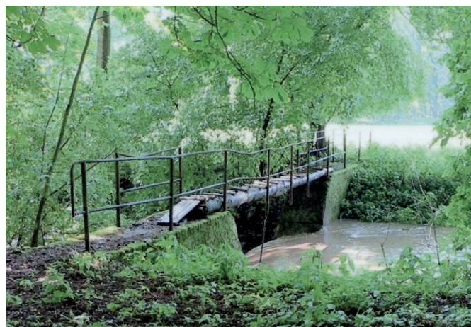
Přehrada v Bažantnici u „kulaté louky“

Nyní se dostávám k popisu toku Zlatého potoka. Na konci již zmíněné bažantnice (ze strany Kobylnic) ještě vidíme splav, od něho teče potok celou bažantnicí. Zde můžeme sledovat jeho cestu kolem tzv. „kulaté louky“.