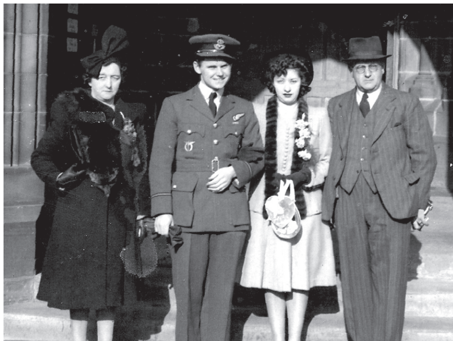
Svatební fotografie s rodiči nevěsty