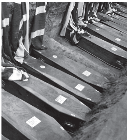
U Londýna 19. října 1942