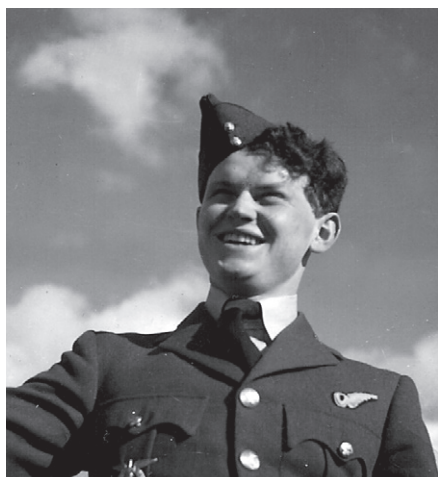
Václav Haňka neděle odpoledne, June 1941

potopená. Za tuto činnost byl Václav Haňka v říjnu 1942 povýšen v anglické hodnosti na kapitána letectva. Dne 18. 10. 1942 byl se svou a ještě další posádkou pozván do Londýna na velitelství Pobřežního letectva k převzetí dalšího vyznamenání, které měl předat prezident