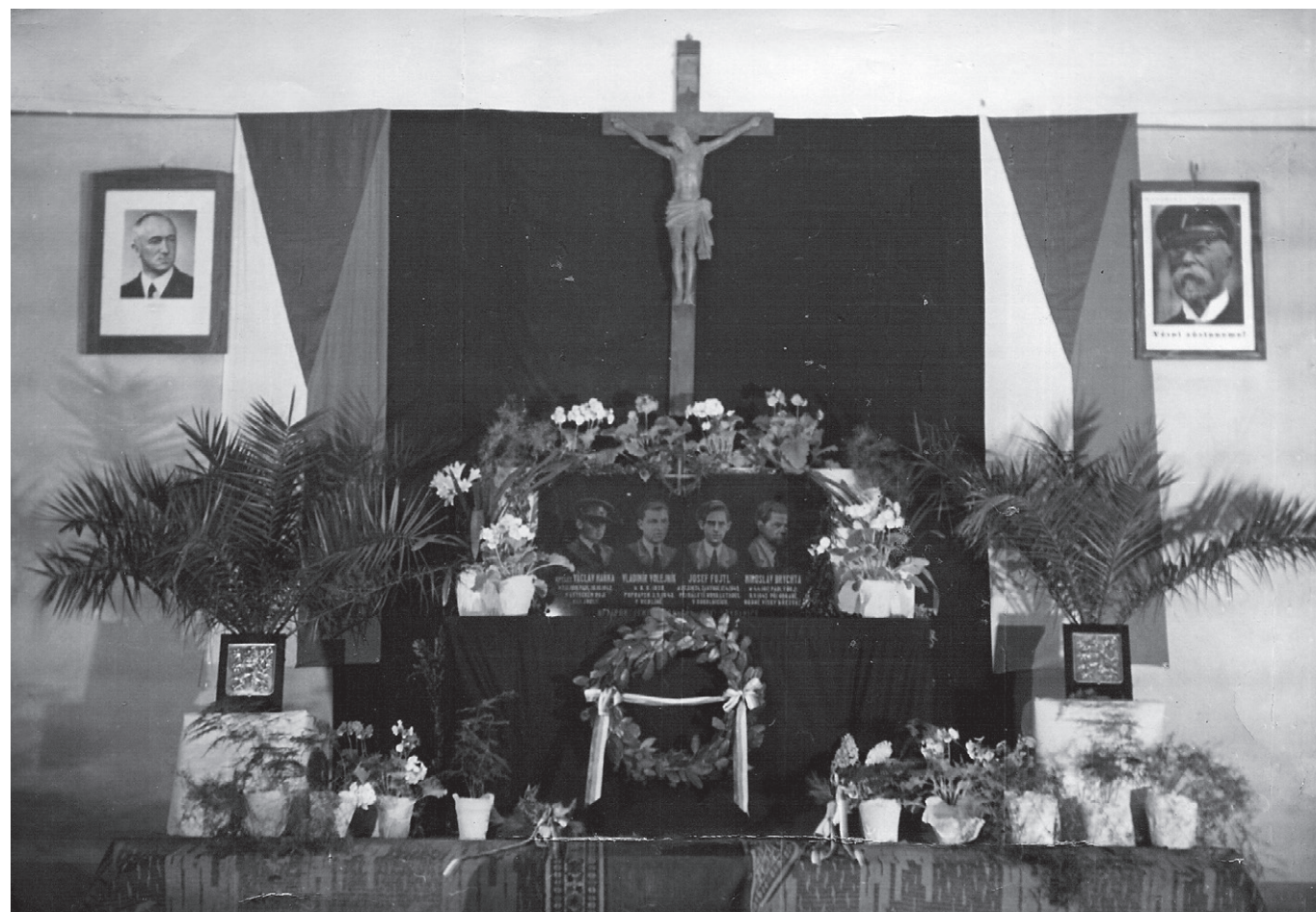
Pamětní deska je uložena na hřbitově v Sokolnicích