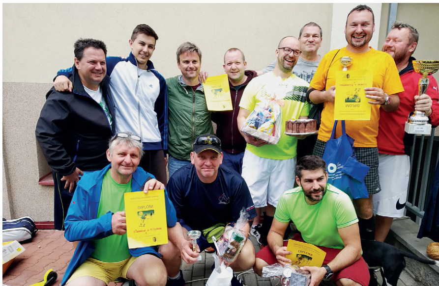
The Lemmer Cup 2019