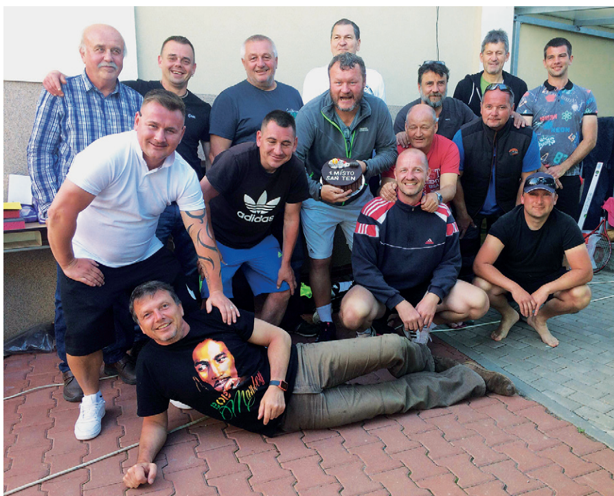
Sañ Ten 2019