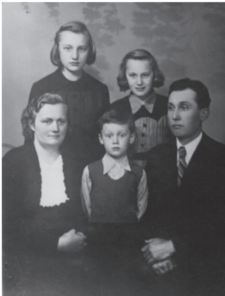
Fotografie s rodiči a sourozenci

Z naší části Sokolnic se chodilo nakupovat k panu Zajíčkoví. Z jeho obchodu mi utkvěl v paměti velký škopek s kvašáky a malá mýdla. U jeho domu byla studna s pitnou vodou, kam si pro ni chodilo mnoho obyvatel. Papírenské zboží a všechno možné do školy prodával pan Bařina, který měl obchod kousek od základní školy.