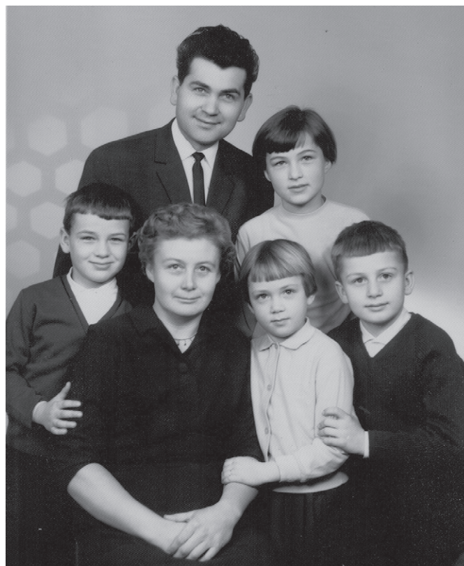
Rodinná fotografie z druhé poloviny 60. let

Po dvou letech na Šumavě jsem se vrátila do Sokolnic a šla pracovat do Brna na Křenovou ulici do papírny.