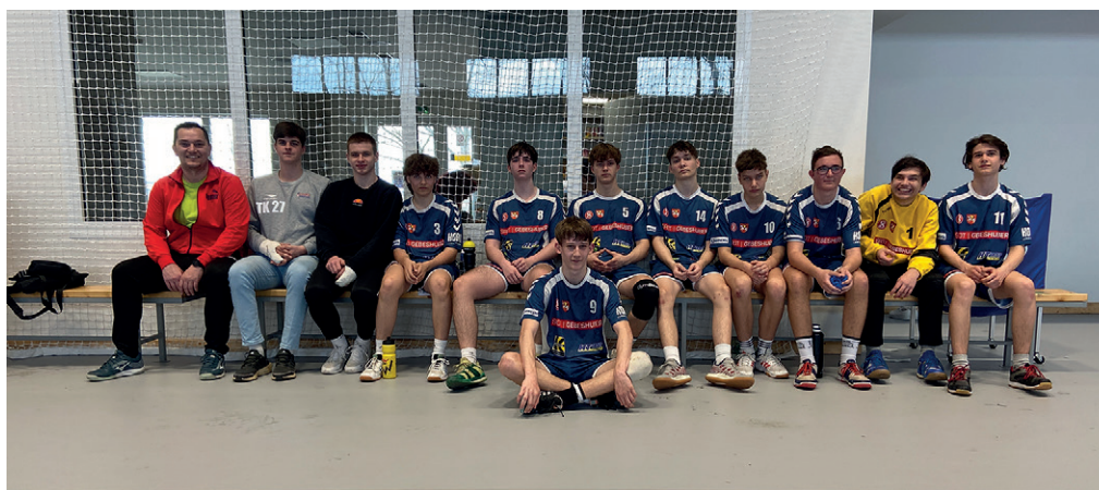
Mladší DOROST, Sokol Sokolnice, sezóna 2022/2023