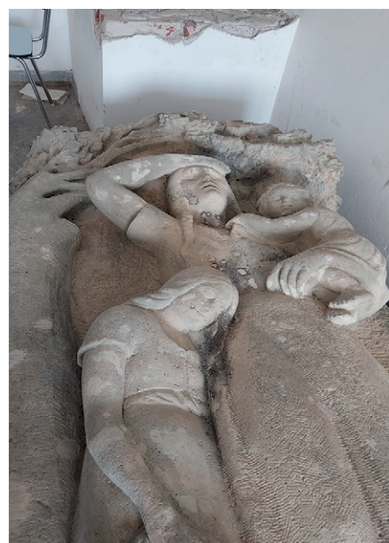
V průběhu prací