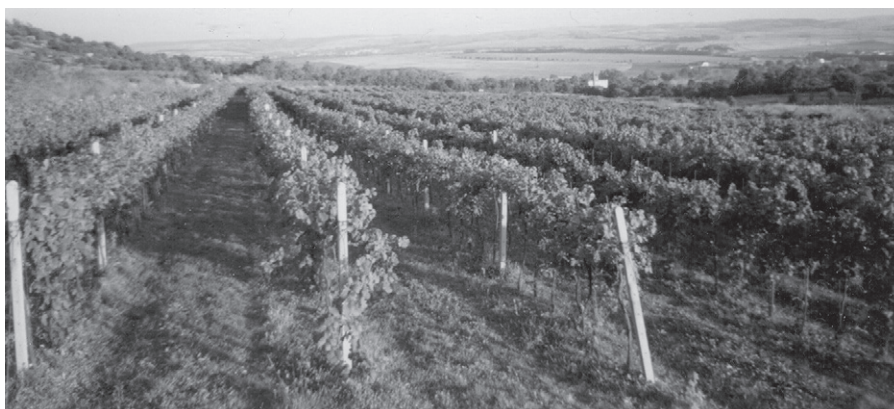
Podoba vinohradu p. Zmrzlého asi před 10 lety

Především se věnuji rodině – jak dcery, tak syna – a velkou radostí jsou pro mě dva vnuci a dvě vnučky. Jsem sice starobním důchodcem, ale stále částečně pracuji v oboru požární ochrany a vodohospodářství.