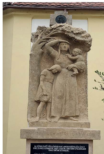
Po dokončení oprav

Kulturní komise obce Sokolnice si Vás dovoluje srdečně pozvat na slavnostní zahájení výstavy