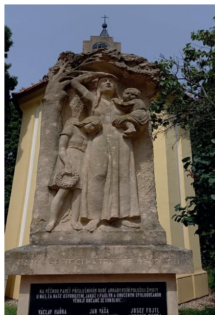
Před zahájením oprav