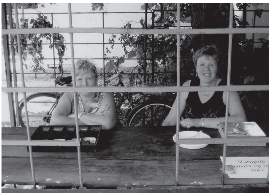
Nejde o žádnou humornou fotku z vězení, ale o pohled na pokladnu při vstupu na házenkářské hřiště.