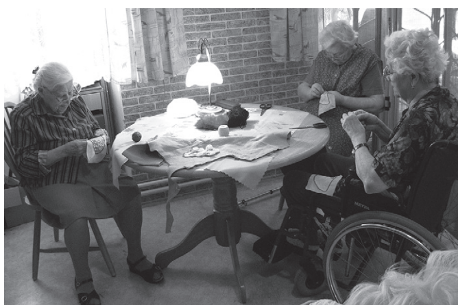
Ruční práce klientek, 8. 1. 2009