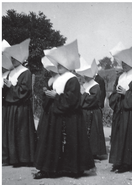
Sestry Vincentky ve škobeneých čepcích v průvodu o Božím Těle u sokolnic. zámku