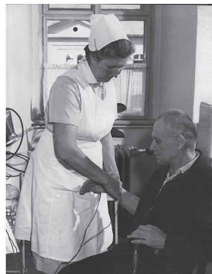
Historické vybavení sesterny