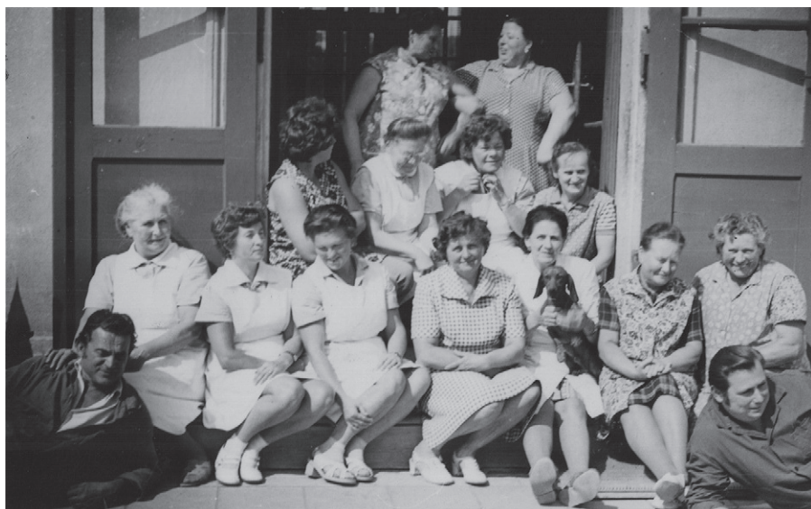
Personál DOMOVA asi před rokem 1978