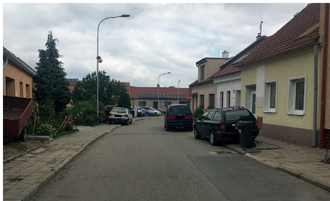
Mezi auty je necelých 2,5 m

V letošním roce jsme zaznamenali již dva případy, kdy řidič hasičského vozu volil cestu k zásahu ne přímou, ale tak, aby vůbec od hasičské zbrojnice vyjel. Kdy naposled