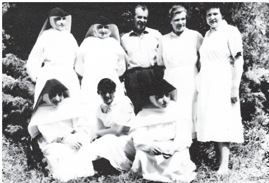
Poslední čtyři sestry de Notre Dame s vedoucím a personálem domova důchodců v Sokolnicích

60. let začaly zajišťovat péči stárnoucím spolusestrám v jiných domovech, kde řeholnice sloužily. Poslední čtyři tak opustily Sokolnice 8. září 1967.