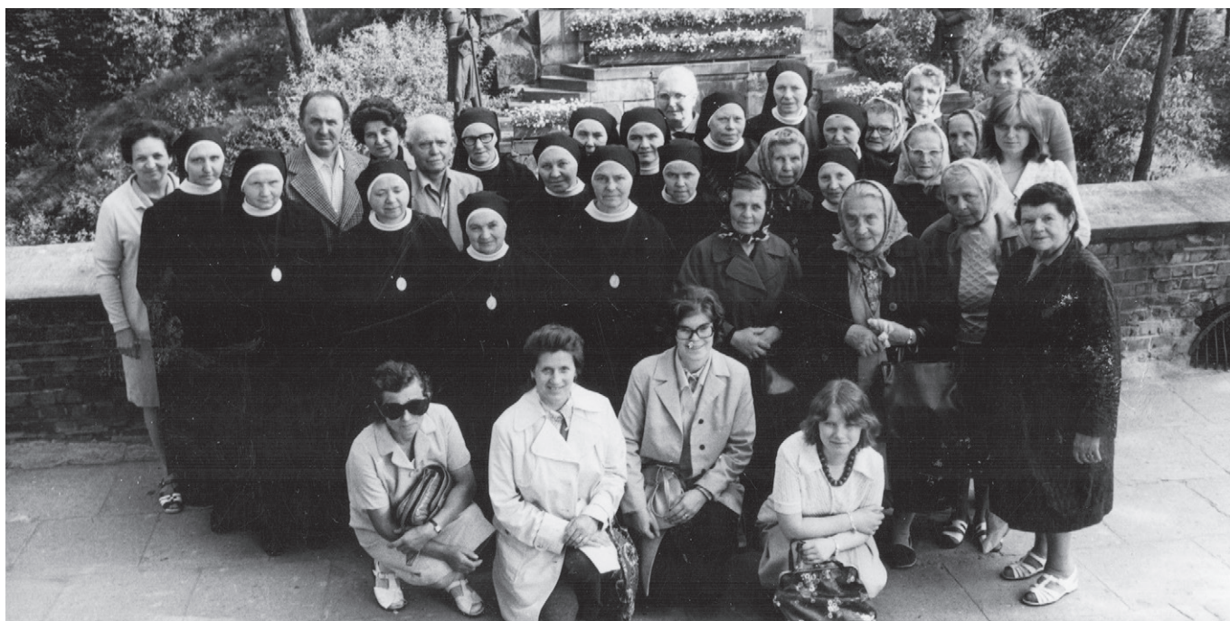
Zájezd sokolnických řádových sester, zaměstnanců a obyvatel domova do Polska, pravděpodobný rok 1975