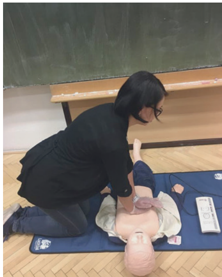
Srdeční masáž na jedné z figurín

Letos jsme si opět pozvali pana Vosáhla – záchranáře z brněnské záchranky s více než 20-letou aktivní praxí, aby nás přišel proškolit v po-