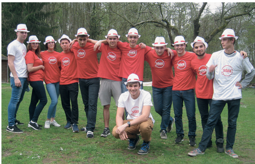
Naši stážisti v SRN

Všechny stážisty rádi uvádíme do zdejšího prostředí. Vstříc nám vychází pan starosta, který všechny přijíždějící zahraniční studenty oficiálně vítá na sokolnické radnici. Studenti se rychle rozkoukávají, a tak zatímco ti ložští slovenští rychle objevili vynikající chuť sokolnických škvarků u místního řezníka, ti letošní v me-