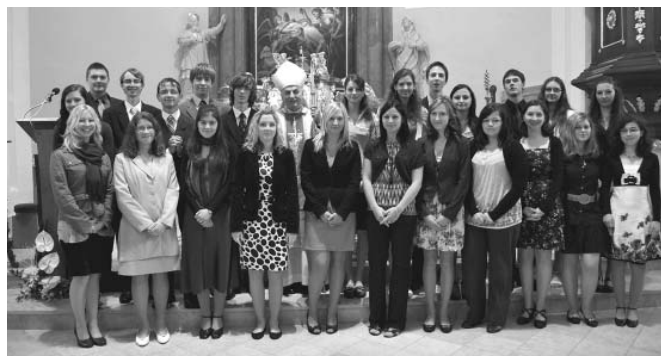
Společná fotografie biřmovanců s otcem biskupem

Srdečně zveme všechny krojované na hodovou mši svatou do zámecké kaple dne 19. června 2011 v 10 hodin.