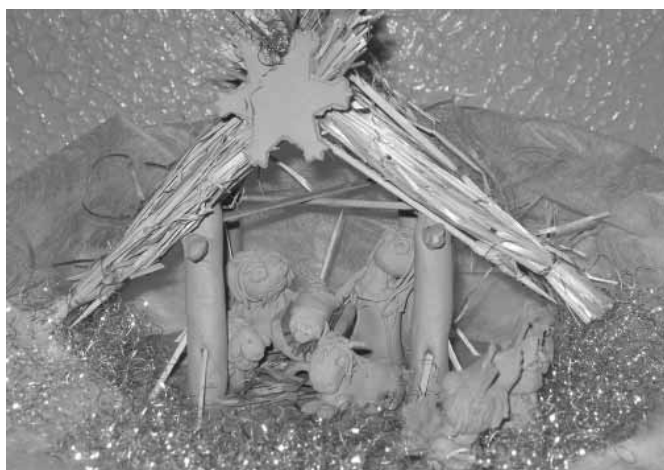
Obrázek vlevo kategorie děti: