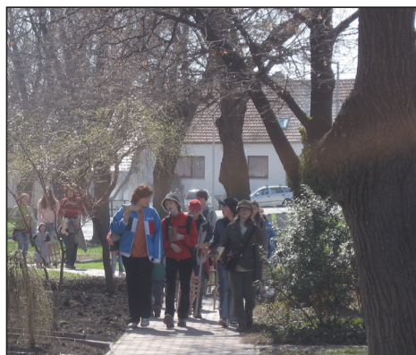
Fotografie z hrkání