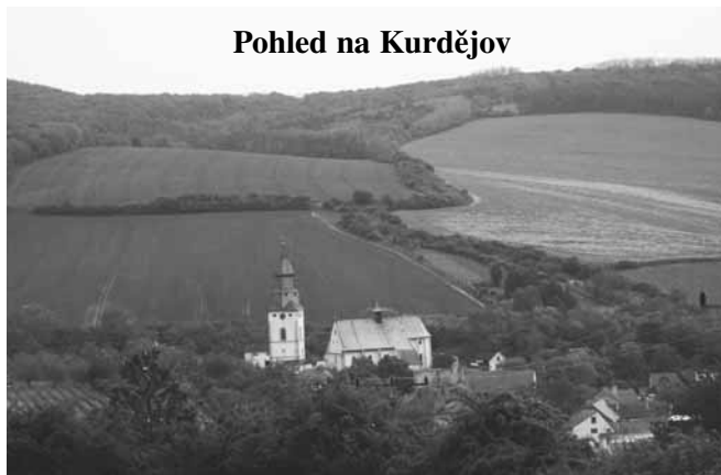
Pohled na Kurdějov