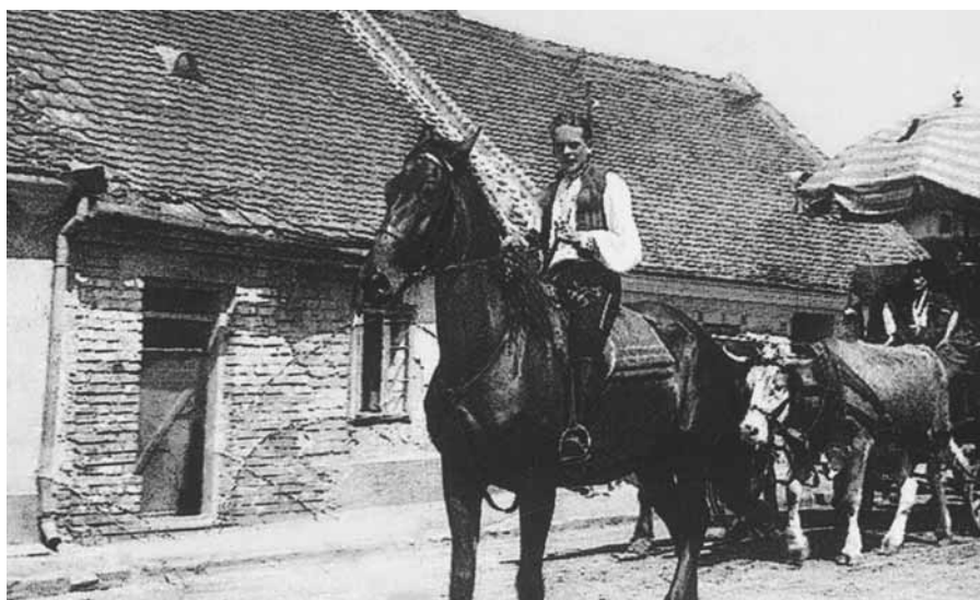
I taková událost jako byly jedny z prvních poválečných hodů v Sokolnicích se neobešla bez užití hovězího dobytka.