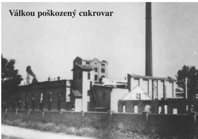
Válkou poškozený cukrovar

Velkým škodám se nevyhnul ani sokolnický cukrovar. Při osvobozování vesnice, dne 24. dubna o páté hodině ranní, byla budova cukrovaru Němci zapálena a z velké části zničena. (rozházením fosforových tyčinek po podlahách a jejich zapálením) Shořely střechy, podlahy, provozní materiál a v cukerním skladišti asi 60 vagonů nevyexpedovaného surového cukru. Strojní zařízení, pokud nebylo