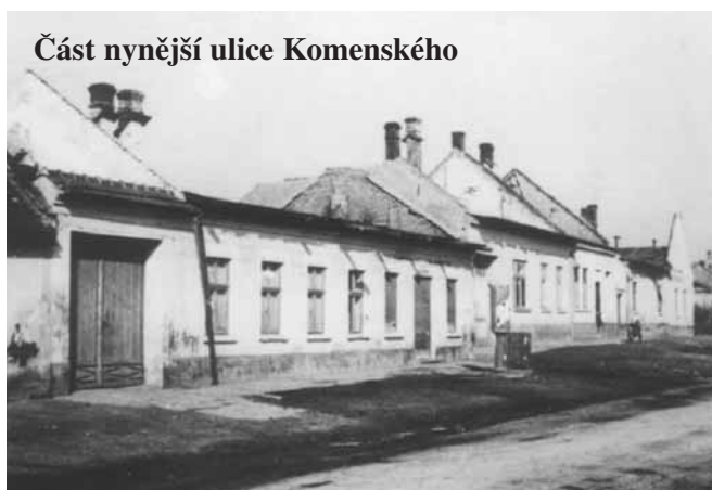
Část nynější ulice Komenského

Jak vypadá dům č. 24 na ulici Masarykova a ulice Komenského dnes? Fotografie na straně 16.