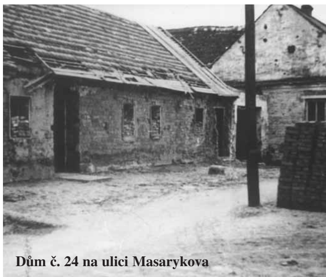
Dům č. 24 na ulici Masarykova