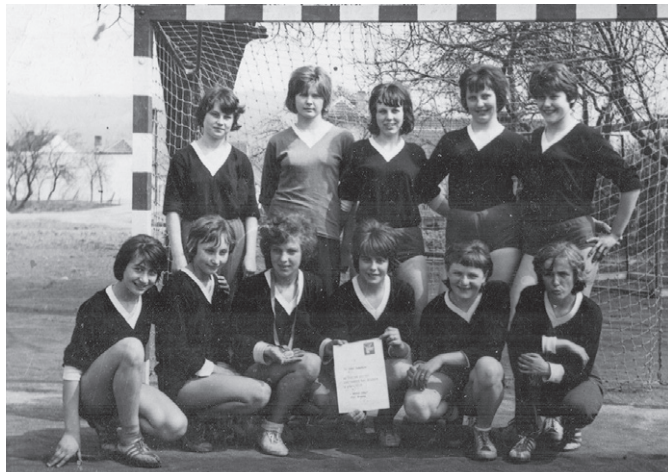
Tým dívčí házené

V rámci Sokola máme neformální uskupení starších sester sokolek a pořádáme různé akce. Jezdíme např. na výstavy, cyklovýlety nebo turistické pobyty, a to i několikadenní, kdy v jednom dni ujedeme i 40 km. Jako starší sestry sokolky se často setkáváme a pořádáme si navzájem u příležitosti narozenin tématické scénky.