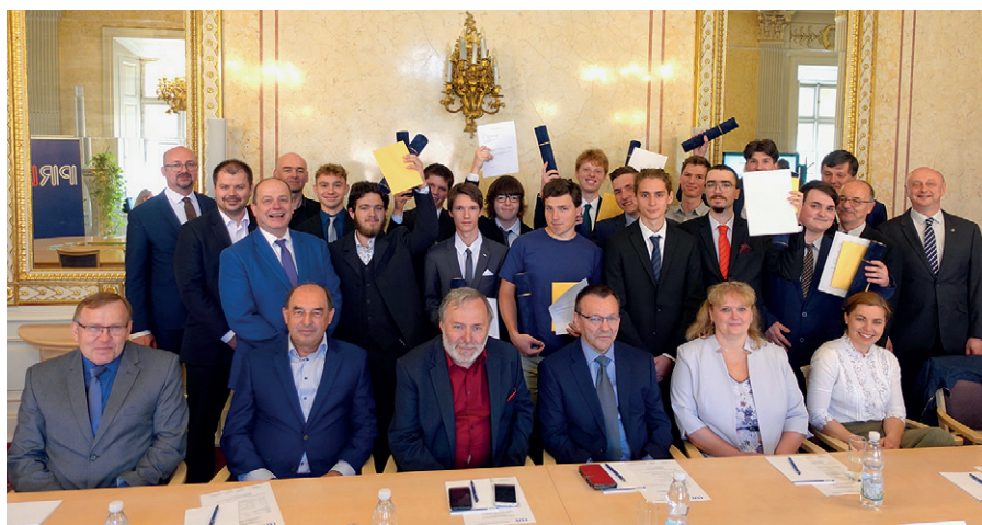
Všichni ocenění žáci