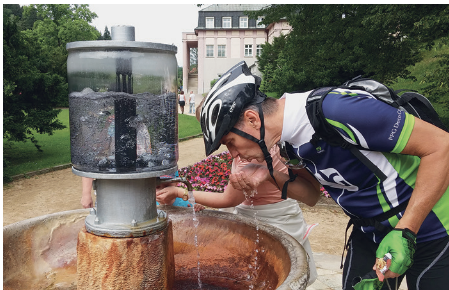
Pramen Dr. Štastného

poblíž dřevěného altánku na rozcestí vedoucí k Jezírku lásky. A protože na světě je stále lásky málo, uděláme si malý výlet do hlubin valašských lesů a lučin. Jezírko samotné spíše připomíná větší louži, když ale budete náležitě potichu, vyjukne na vás třeba místní vodník a můžete si zde pěkně odpočinout a občerstvit se pod altánem ve tvaru valašského klobouku... Málokdo také ví, že ve zdejší lokalitě se nachází naleziště mohylových hrobů slovanských válečníků, datujících se do 9. století. Celá trasa lesem je pěkně značená turistickými