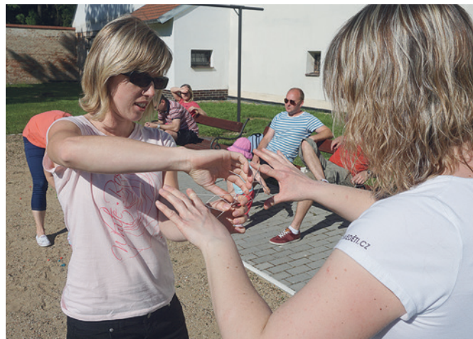
Přebírání provázkových obrázků