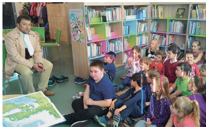
Povídání s panem Andersenem

Letos slaví své výročí i český komiks Čtyřlístek a tak jsme část večera věnovali i jeho hrdinům. Děti viděly nejstarší