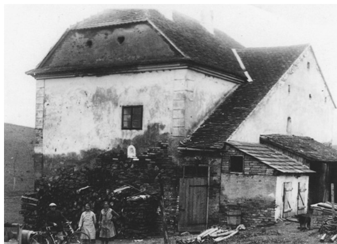
Presshaus – úkryt většiny sokolnických občanů za II. světové války