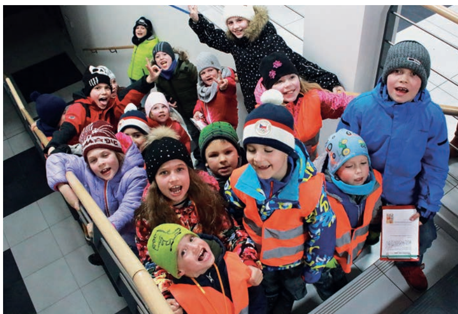
Vyrážíme na cestu

Moc jsme si to užili a těšíme se zase příští rok. ■