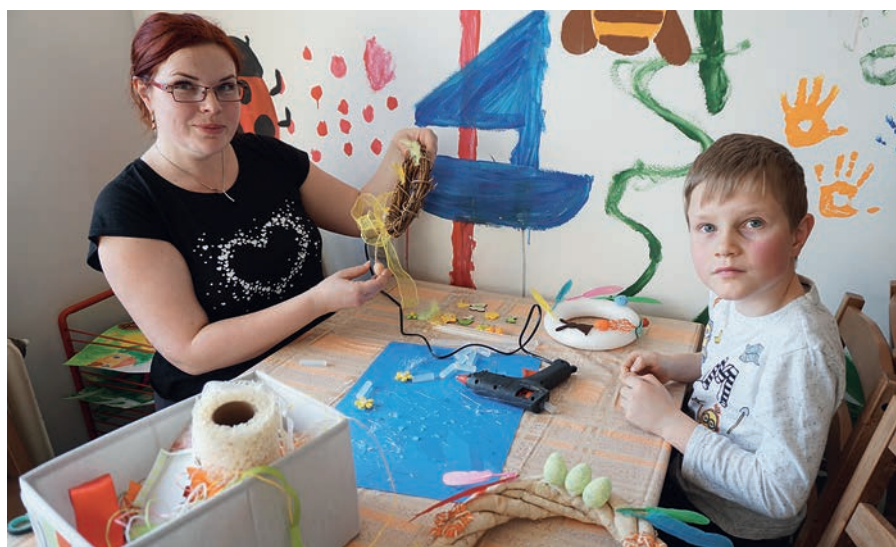
Pletení kuřátek, stříhání králíčího klobouku a lepení králíčího čumáčku