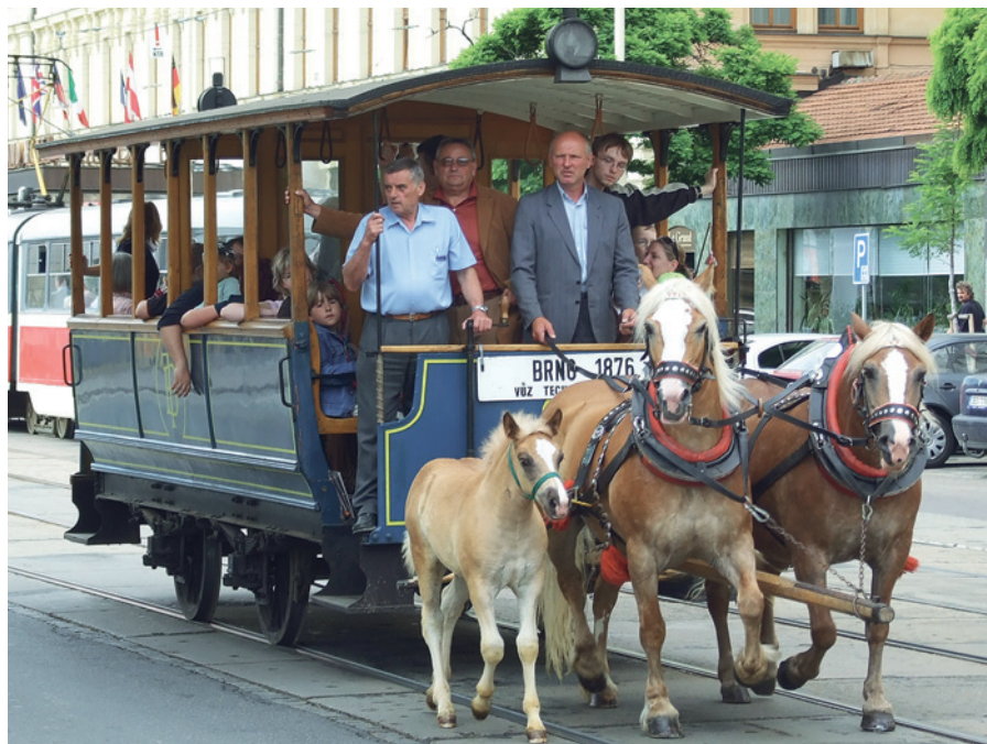
Koněspřežná tramvaj v Brně (provoz: 1869–1874, 1876–1880).

Označení „Scheisse linie“ se v hovorové řeči zkrátilo na „šalinie“, až z toho nakonec vyšla „šalina“.