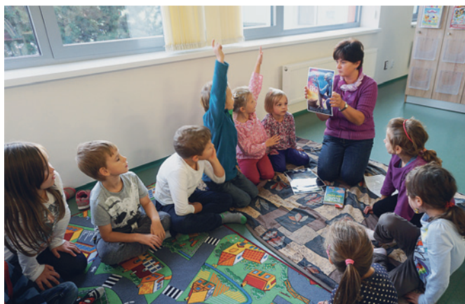
Čtení v kroužku

Úžasný spisovatel knih pro děti i dospělé Roald Dahl by letos oslavil 100 let od svého narození. V pátek 14. října