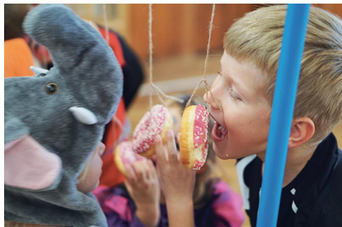
Pojídání koblih bez rukou

Moc jsme si to užili. Děkuje všem za účast.