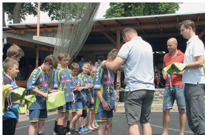
O pohár starosty obce Sokolnice