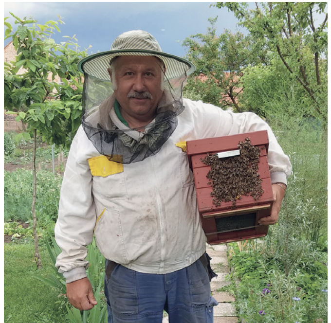
Odnášení roje ze sousedovy zahrady

Kromě přirozeného množení formou rojů včelaři nejčastěji množí včelstva pomocí oddělků, kdy od půlky května odeberou část plodu bez matky, umístí jej mimo včelnici a včely si vychovají z otevřeného