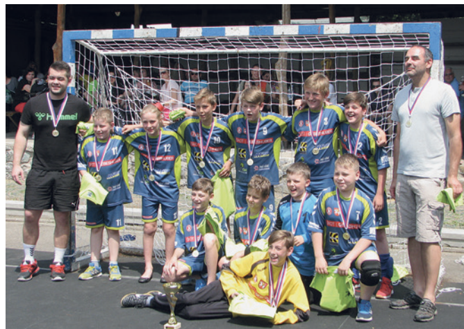
Házenkářské družstvo – mladší žáci