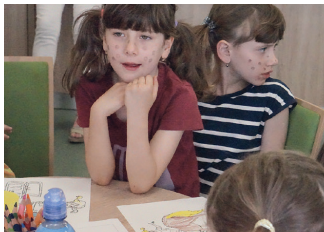
Pipi kam se díváš