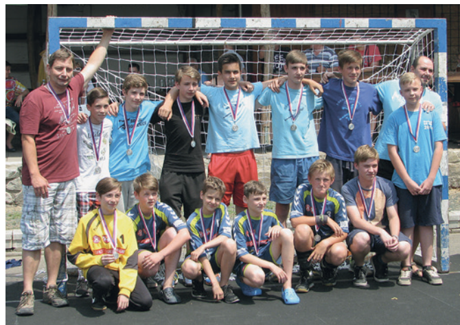
Házenkářské družstvo – starší žáci