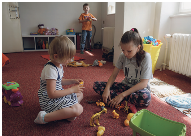
Naše nová herna