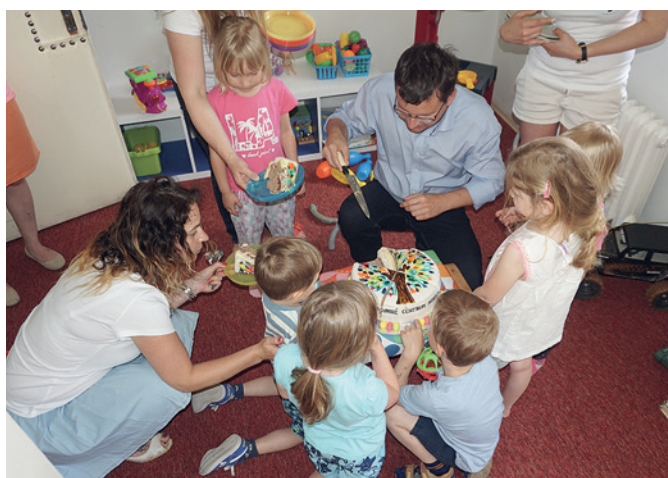
Krájení narozeninového dortu