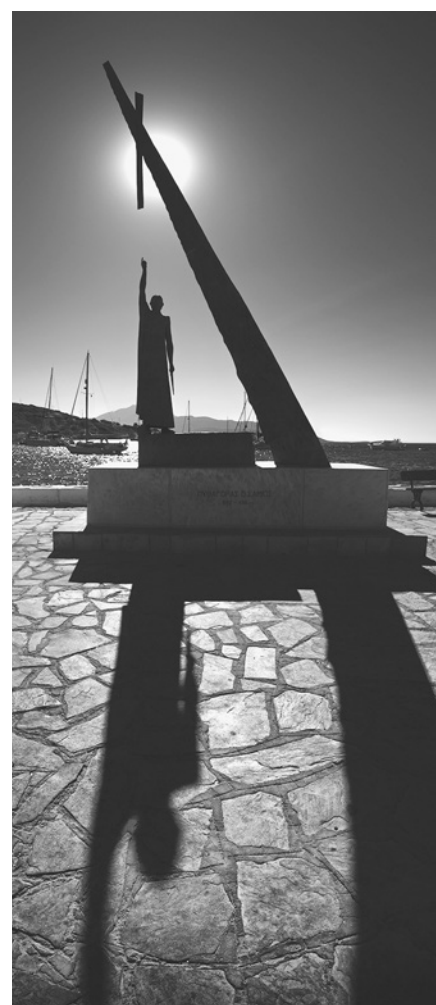
Pythagorův pomník