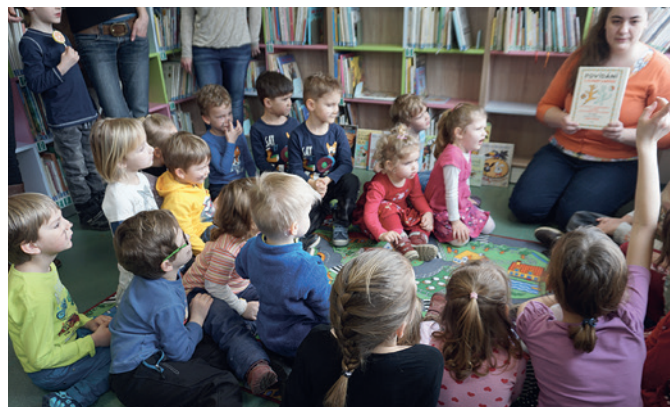
Povídání o pejskovi a kočičce

V sobotu 12. března přišly děti do knihovny na první předčítání. Povídaly si o pejscích a kočičkách a pomocí barviček na obličej se samy na chvíli proměnily v pejsky a kočičky. Dozvěděly se o sourozencích Čapkových a jejich slavných čtyřnohých kamarádech. Poslechly si pohádku Jak si pejsek s kočičkou dělali k svátku dort . Po krátké přestávce s občerstvením děti čekala zábavná hra – hledání ingrediencí do jejich dortu, které byly po-