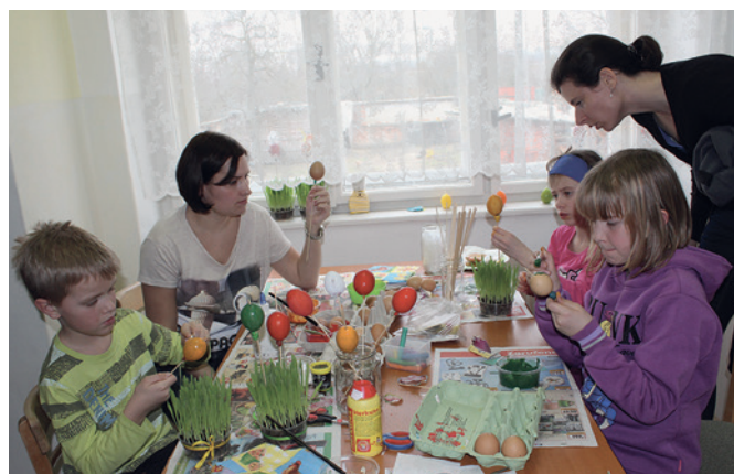
▲ Tvoření dekorací

V sobotu 19. března se v prostorech centra konaly velikonoční dílny. Téměř třicet dětí i se svými rodiči mělo o zábavu na celé odpoledne postaráno. Děti se zabavily u kreativních činností - zdobily vyfouklá vejce, vyráběly věnec na dveře či okno, ovečku z popcornu a také si nazdobily perníčky. Každé z dětí dostalo zelené osení a spolu s vlastními výtvary si tak domů odneslo pěkné jarní dekorace. Velice přínosným, a jak se i zdálo mezi rodiči vyhledávaným, doprovodným programem bylo pletení pomlázek pod vedením zkušených dědečků pana