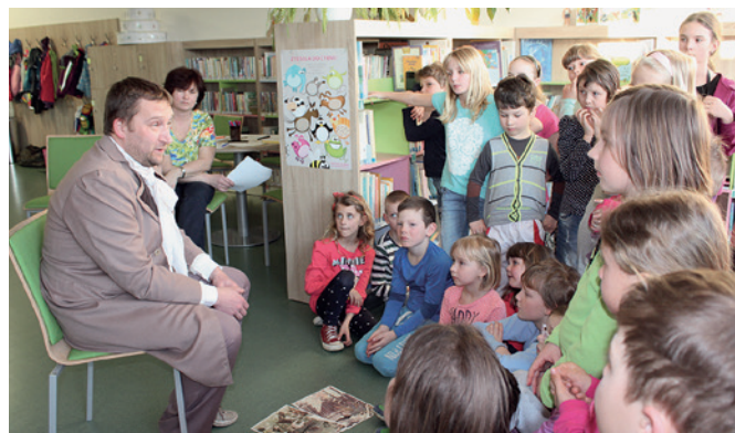
Rozhovor s panem Andersenem

Proto si děti si nejprve povídaly o Dánsku, o jeho známých městech a osobnostech, ochutnaly drømmekage – snový dort a přivítaly milou návštěvu v podobě samotného pana Hanse Christiana Andersena. Ptaly se ho na spoustu zajímavých otázek a dostaly ještě zajímavější odpovědi. Jako proč neměl rád své jméno, s čím si jako kluk hrál a proč psal tak smutné pohádky.