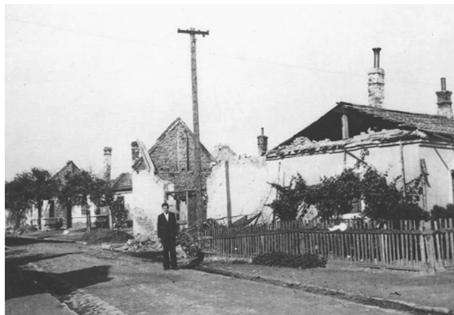
Střed obce po náletu