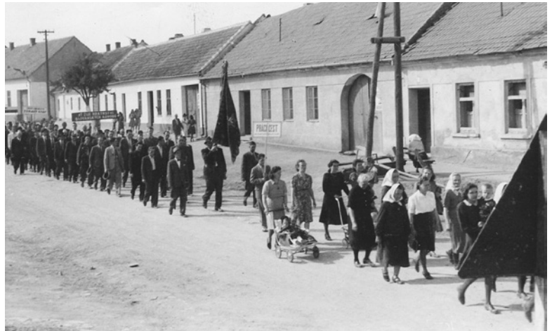
Průvod obcí po ukončení II. světové války