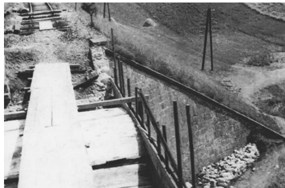
Most přes Zlatý potok

Brzy po našem mostu zničili nacisté kamenný most za Chlčicemi a u Brna mosty přes Svítavu a Svratku.