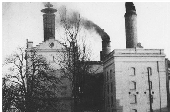
Bývalá sladovna u sokolnického nádraží

Ohromná škoda pro náš kraj byla způsobena tím, že dne 24. dubna těsně před příchodem Rudé armády byl zapálen sokolnický cukrovar, v němž bylo požárem zničeno asi 60 vagonů surového cukru a téměř úplně zničeno všechno strojové zařízení. Zničením cukrovaru, pro válku naprosto bezvýznamného, bylo zkráceno mnoho obyvatelstva o slušný výdělek v době kampaně. Potrvá ještě dlouho, než začne pracovati nově zřízený cukrovar.