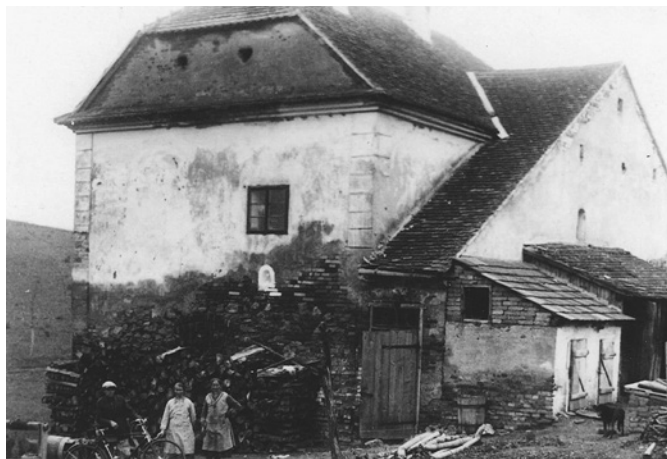
Presshaus – úkryt většiny sokolnických občanů za II. světové války

My jsme byli pozváni panem řídícím učitelem Hadašem do školního sklepa. Na dvoře školy byla vojenská kuchyně, kuchaři byli Rakušané. Byli na nás sice hodní, ale nebylo to příliš bezpečné místo. O ochranu obyvatel se postarala obec, která pro ně našla další vhodné úkryty. Jeden byl pod zámekem, druhý pod pivovarem a třetí, kam jsme odešli i my, byl pod „Presshausem“. Byly zde jak matky s dětmi, tak i staří lidé. Hygiena byla nedostačující, pouze jeden