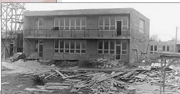
Staveniště areálu mateřské školy