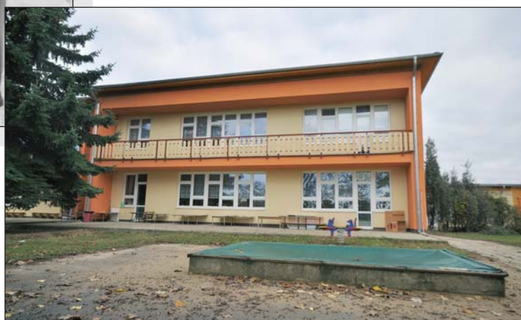
Pohled na budovu po rekonstrukci ze dne 30. října 2009

Uzávěrka Sokolnického zpravodaje č. 11 je 20. 11. 2009. Příspěvky, prosím, předávejte elektronickou poštou na níže uvedené adresy, na disketě nebo v papírové podobě členům komise pro vydávání Sokolnického zpravodaje: