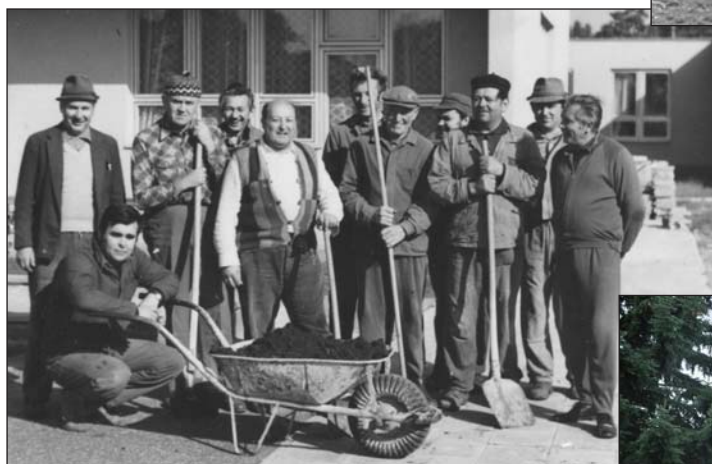
Brigáda zahrádkářů na mateřské škole – úprava areálu dne 7. října 1979