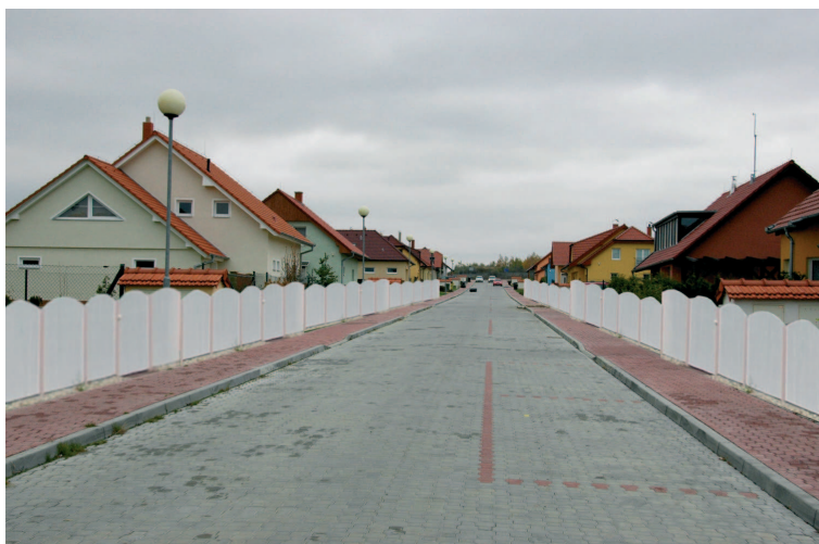
Jak se vám líbí ulice s ploty? (fotomontáž)

Přeloženo do lidské řeči, při pohledu z ulice by domy, přístřešky, ploty a další stavby neměly zasahovat do ulice více než stávající zástavba. Toto ustanovení vede v praxi k tomu, že majitelé domů se musí „vzdát“