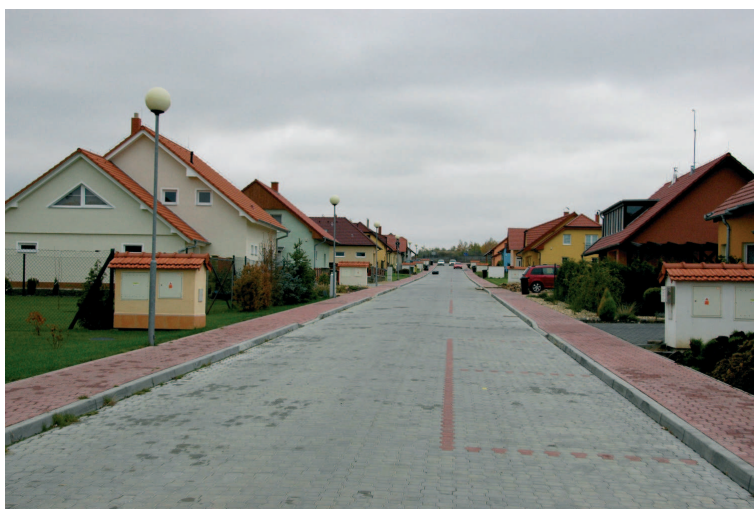
Ulice U Bažantnice – stávající stav

části svého pozemku v zájmu zachování tradičního charakteru zástavby. S touto podmínkou užívání pozemku byli seznámeni všichni, kdo od obce pozemky v posledních letech kupovali.