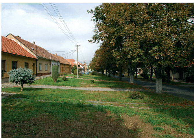
Ulice Masarykova, Sokolnice