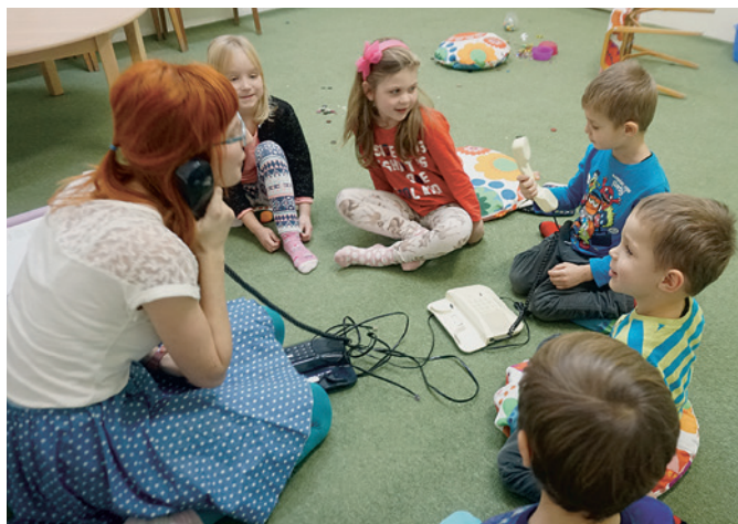
Voláme hasiče, Vánoce jsou ohroženy