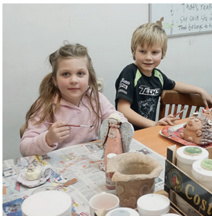
Pohoda na keramice