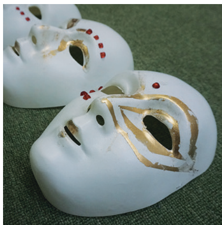
Masky dětí z dramatického kroužku

Všechny děti i lektori si hodiny moc užili.