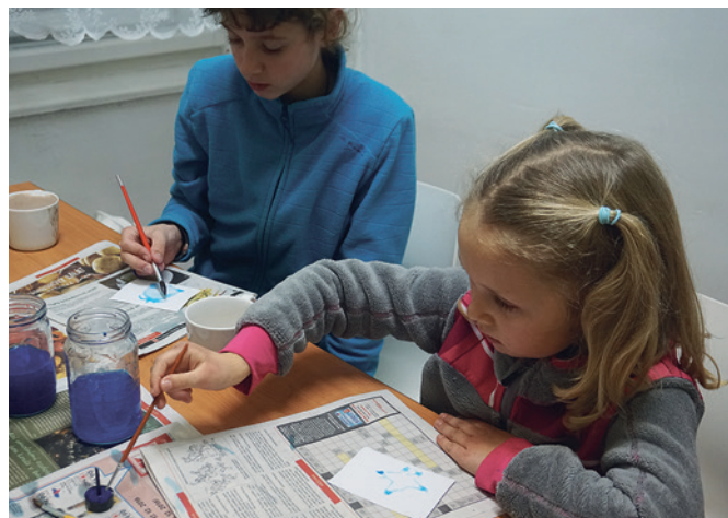
Vyrábění novoročních přáníček