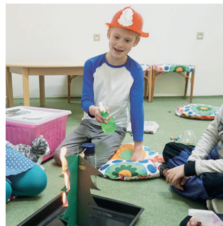
Hoří nám vánoční stromeček!