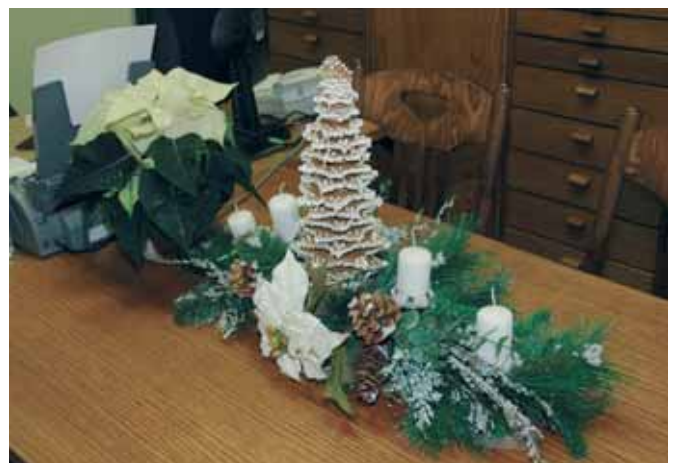
I vánoční dekorace na stole paní ředitelky je dílem zaměstnanců a obyvatel