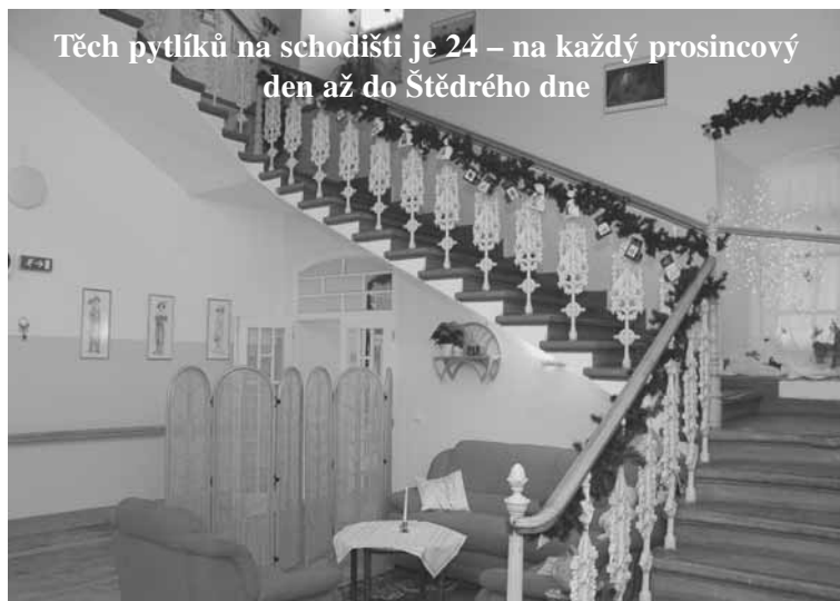
Těch pytlíků na schodišti je 24 – na každý prosincový den až do Štědrého dne