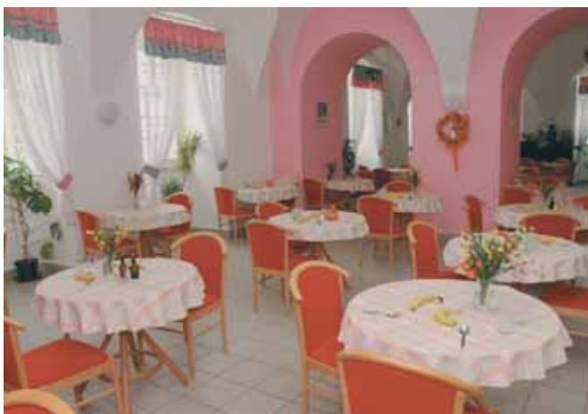
Útulnost jídelny si nezadá s luxusní hotelovou restaurací

1991 poté, co vyhrála výběrové řízení na místo