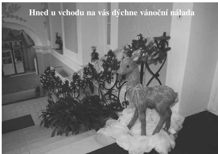
Hned u vchodu na vás dýchne vánoční nálada

A výsledek? Ten vnější, ten můžete vidět, když půjdete kolem: opravený zámek, udržovaný park, rekonstruované domky v zadní části parku nebo nové sociální zázemí pro obyvatele. To ale dokáže každý schopnější manažer. To mnohem cennější ale neuvidíte. Stačí se ale zeptat kohokoliv, koho v domově potkáte, jak se mu v domově líbí. Dříve či později (ale spíše dříve) určitě zmíní paní ředitelku a budete si jisti, že ji bude chválit a je jedno, jestli je to obyvatel domova nebo zaměstnanec. A rozhlédněte se kolem sebe, je jedno, jestli je podzim, advent nebo Velikonoce – v domově vždy najdete nádhernou výzdobu, která není dílem profesionální aranžérské firmy, ale společnou tvorbou zaměstnanců a obyvatel. A všichni ji dělají dobrovolně nad rámec svých povinností. Co se skrývá za tím, že všichni věnují takové úsilí zvelebování prostředí, ve kterém bydlí a pracují? Odpověď je opravdu velmi jednoduchá, je to osoba paní ředitelky Skuhrovcové.