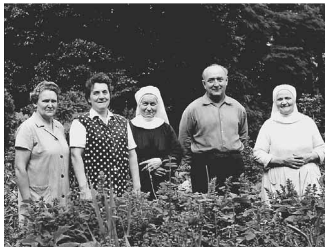
Sokolnice, v parku