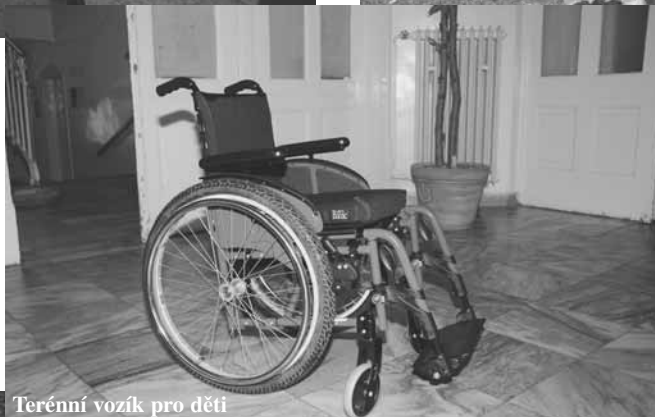
Terénní vozík pro děti