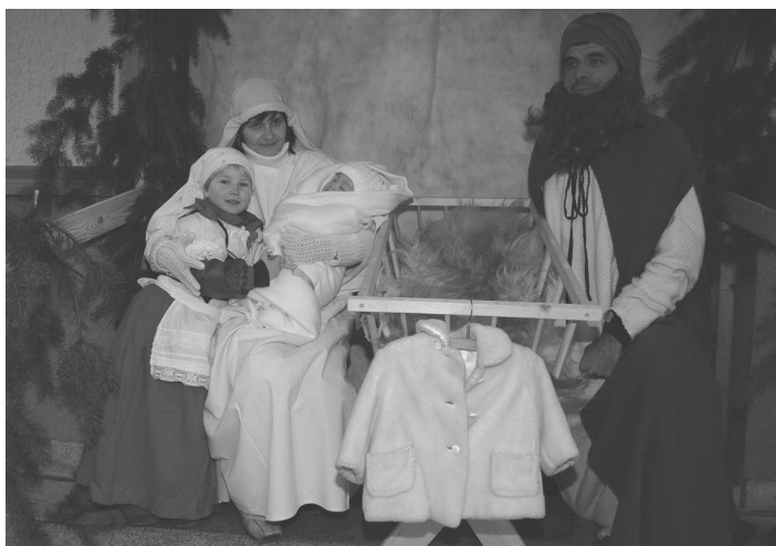
Svatá rodina s kolemjdoucí selkou, která přinesla Ježíškovi dary

kteří Ježíškovi přinesli své dary, mezi nimi například krejčího, hajného, pekařku nebo řezníka.